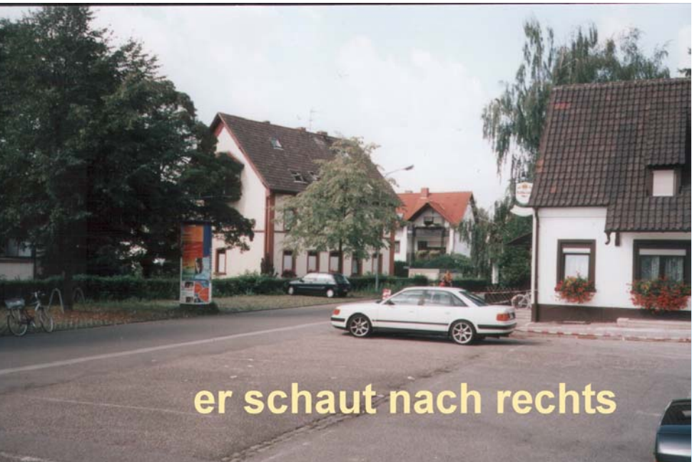
er schaut nach rechts