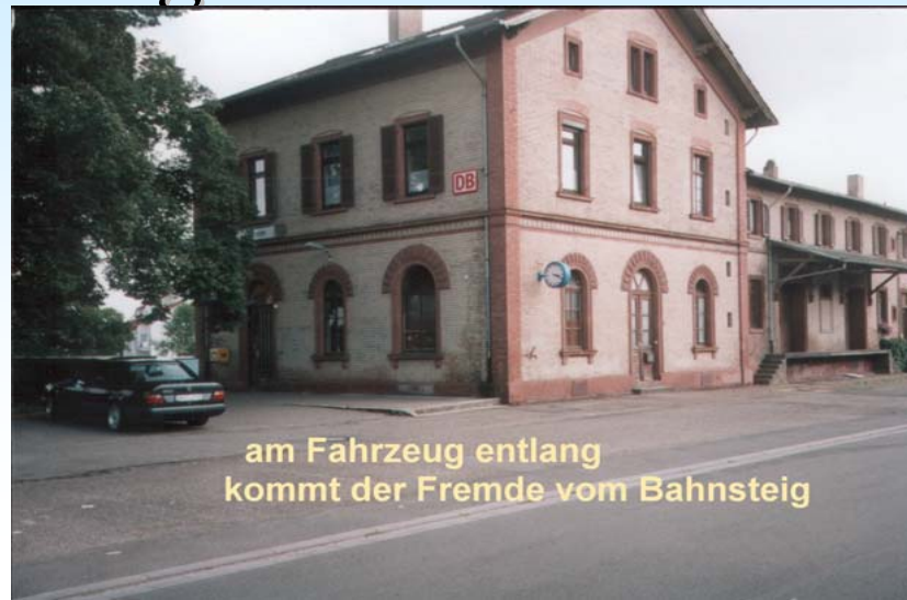
am Fahrzeug entlang kommt der Fremde vom Bahnsteig