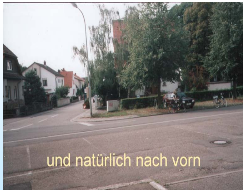
und natürlich nach vorn