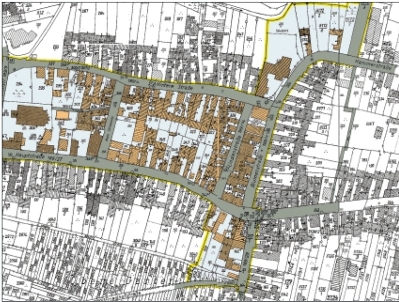
Lageplan Bellheim 2003 mit neuzugestaltendem Ortskernbereich

ter, insbesondere die Karlsruher, haben das Dorf-Ambiente von Bellheim lieben gelernt. Sie kommen und genießen es, wesentlich preiswerter als bei sich zu Hause die Dienstleistungen in Bellheim zu nutzen. Viele Karlsruher versuchen ihren Lebensabend in Bellheim zu verbringen. Die Nachfrage nach „altersgerechtem Wohnen“ hat das Senioren-Zentrum Haus Edelberg zur Planung eines 2. Erweiterungsbaus gezwungen.