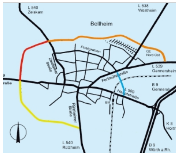
Vision Straßennetz Bellheim 2020: Westspanne (rot), Nordrandstraße mit Querspange (orange), Südrandstraße (gelb) Verbindungsstraße „Häßlich“ (blau)

Die Südumgehung wurde nicht gebaut. Dafür ist eine Verbindungs-Spange von der Zeiskamer-Straße zur L509 in Richtung Knittelsheim gebaut worden. Ebenso wurde das Wohngebiet „Häßlich“ mit der L539 in Richtung Germersheim verbunden. Die Nordrandstraße wurde gebaut. Sie verbindet die L540 von Zeiskam mit der L538 nach Westheim. Von dort wird sie durch das neue Gewerbegebiet auf die L539 Richtung Germersheim geführt. Aus Umweltverträglichkeitsgründen musste sie jedoch mehr in Richtung Süden näher zum Ort gebaut werden. Dadurch ist das geplante Neubaugebiet im Norden nicht erschlossen worden. Auch eine Südrandstraße wurde gebaut. Sie erstreckt sich vom Kreisel von Knittelsheim kommend bis zur L540 in Richtung Rülzheim. Die Zeiskamer-Straße ist für den normalen Durchgangsverkehr gesperrt. Für LKW's gibt es nur die Möglichkeit über die Ortsrandstraßen zu fahren.