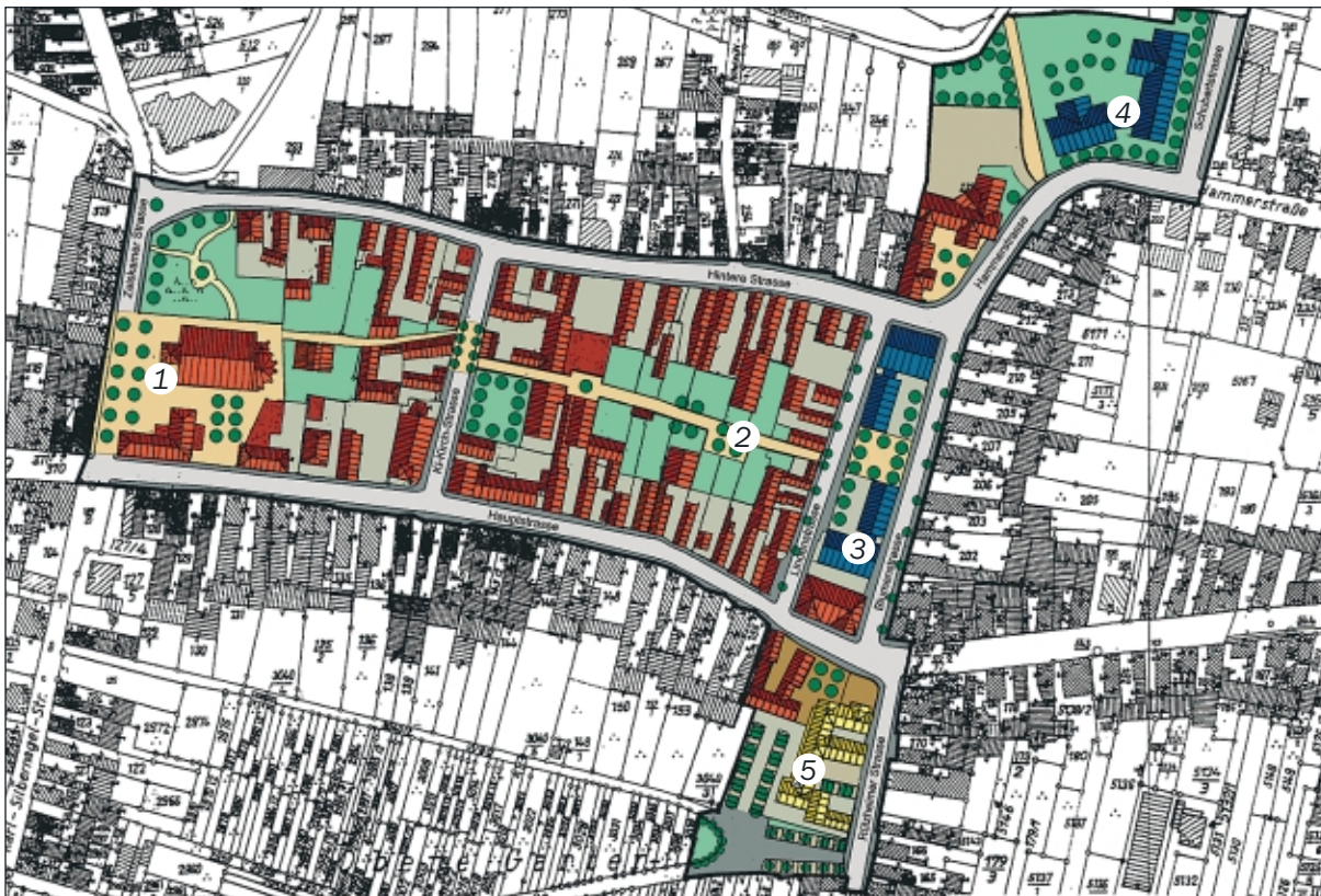
Lageplan Bellheim 2020 mit neuem Ortskern: 1) neuer Kirchenvorplatz 2) Dorferlebnis- Atmosphäre 3) Dorfplatz mit Tief- garage und Service Center mit „Betreutem Wohnen“ 4) Geschäftspassage mit „Betreutem Wohnen“ 5) Dienstleistungs- zentrum

In der Blumen- und Lindenstraße ist eine Tiefgarage , die mit 2 Geschäftspassagen überbaut ist. Über den Geschäften wohnen Menschen im „ Betreuten Wohnen “. Auch in den renovierten alten Wohnhäusern in der Nähe dieser beiden Straßen