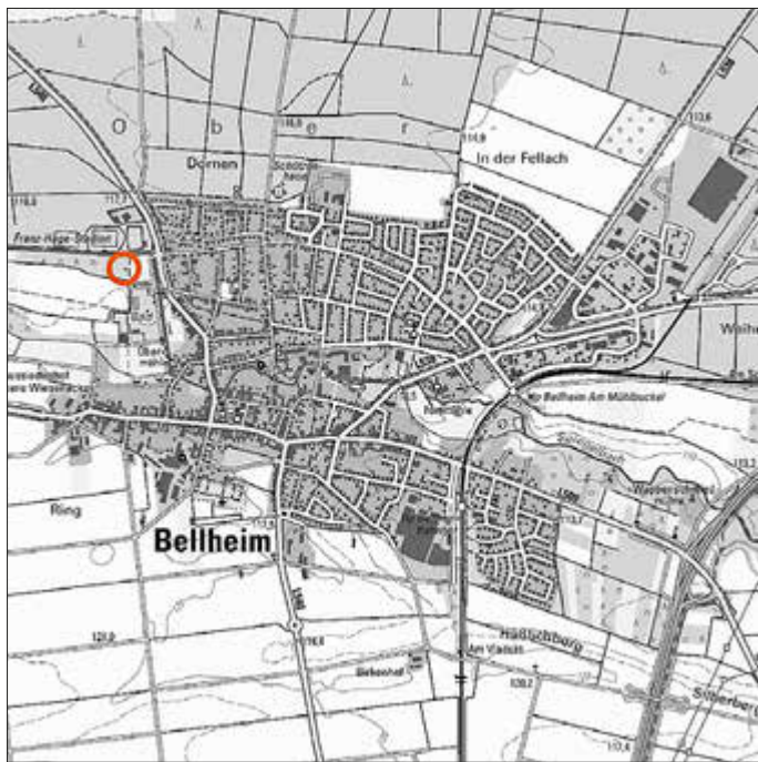
Lage des Plangebiets

Der Bebauungsplan soll im vereinfachten Verfahren ohne Durchführung einer Umweltprüfung nach § 2 Abs. 4 BauGB aufgestellt werden.