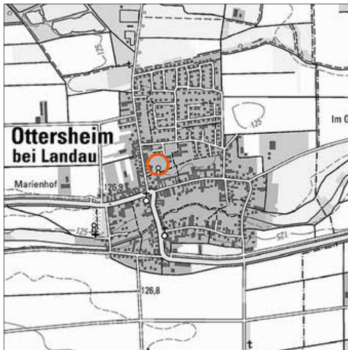
Lage des Plangebiets

Hat jemand eine Verletzung nach Satz 2 Nr. 2 geltend gemacht, so kann auch nach Ablauf der in Satz 1 genannten Frist jedermann diese Verletzung geltend machen.