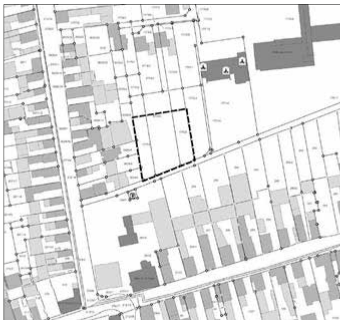
Geltungsbereich des Bebauungsplans (nicht maßstäblich)

Geobasisinformationen der Vermessungs- und Katasterverwaltung Rheinland-Pfalz © 2025