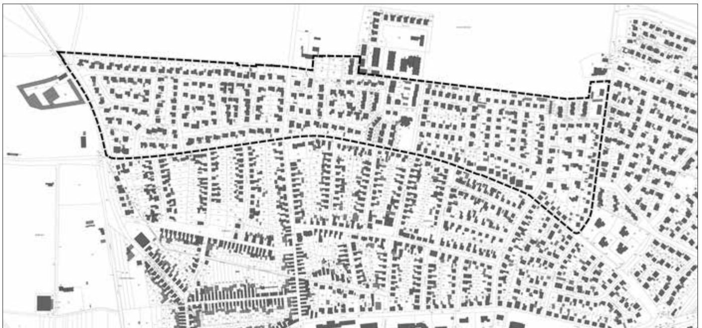
Geltungsbereich des Bebauungsplans (ohne Maßstab)