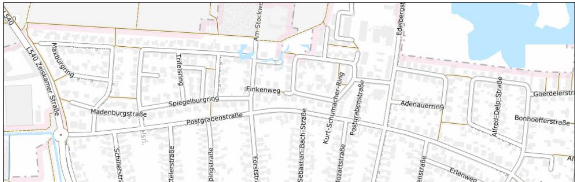
Betroffene Nutzungen in einem hundertjährigen Hochwasserereignis (HQ 100), Quelle: Hochwassergefahrenkarte LfU RLP

Bei Sturzflut sind im Gebiet Fließgeschwindigkeiten von maximal 0,5 m/s bei Wassertiefen von maximal 50 cm, an vereinzelt Punkten auch bis zu 100 cm zu erwarten.