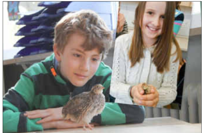
Die Wachteln sind schon soooo groß.

Die Wachteln waren in kürzester Zeit ganz schön gewachsen! Die Kinder haben mit Spannung und Vorfreude jeden Morgen die Schule betreten. In der Zwischenzeit sind die Tiere in ein größeres Gehege bei Familie Renner Kraus umgezogen.