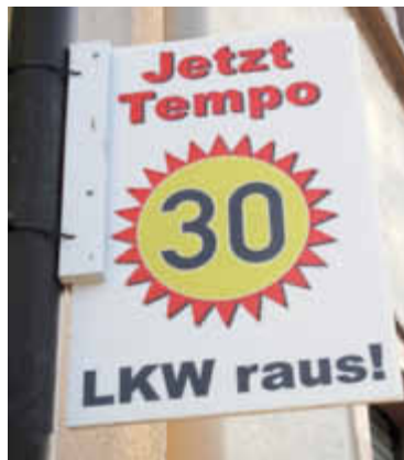
Schilder, wie sie zur Zeit auch in Knittelsheim und Ottersheim zu sehen sind

Die Bürgerinitiativen Verkehrs-entlastung Bellheim, BiSchlaD Knittelsheim und Bib30Plus Ottersheim informieren