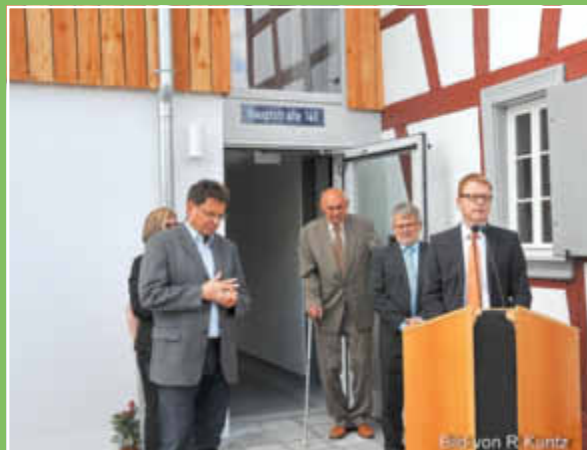
Glückwünsche zur gelungenen Renovierung überbrachte auch MdB Thomas Gebhardt.