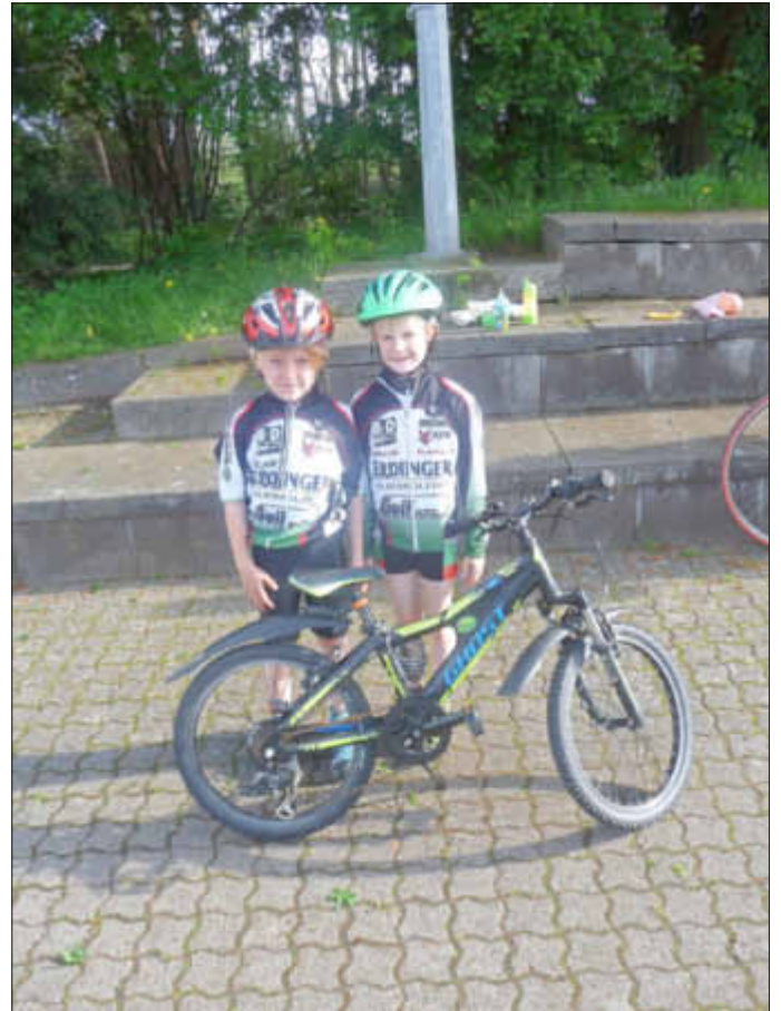
Der Nachwuchs für das Team Erdinger alkoholfrei sitzt schon im Sattel

Er konnte sich in der letzten Runde vom Hauptfeld absetzen und einer 5-köpfigen-Spitzengruppe, im Alleingang, folgen. Am Montag sollte er ebenfalls auf der Bahn in Dudenhofen starten, doch wurde sein Ren- nen wegen des einsetzenden Regens abgesagt.