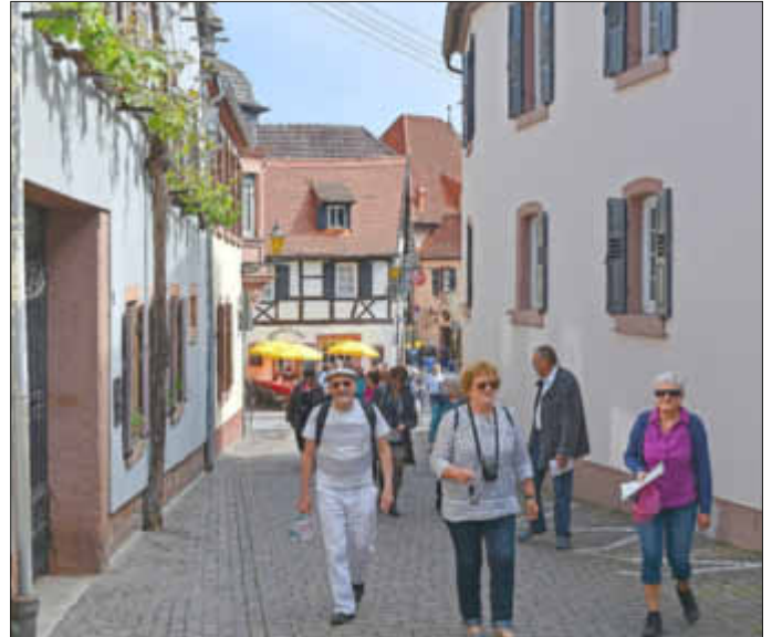
In St. Martin

Den Samstag verbrachte man zusammen in St. Martin, wo die Fußschwächeren im Ort verblieben, die Fitten auf die Kropsburg gingen und die „Wanderkerle“ eine Tour zur Klausental-Hütte machten.