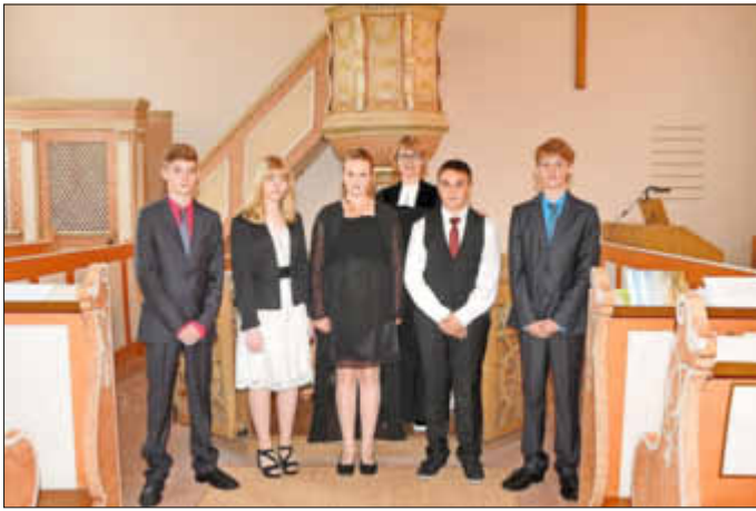
Die Konfirmanden mit ihrer Pfarrerin nach dem Festgottesdienst am 17. Mai.