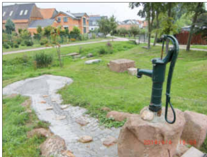
Es kann plätschern...