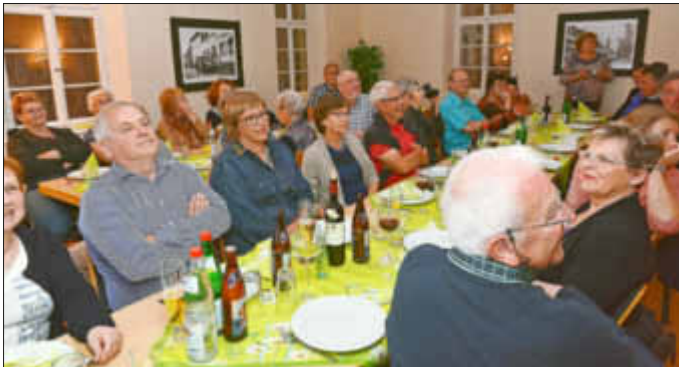
Im „Alten Kindergarten“

Diese hielt auch den ganzen Abend, den man im Alten Kindergarten verbrachte, gut an. Lachend und schwatzend machten sich alle mit gutem Appetit über Spanferkel und Kartoffelsalat her. Beim Kuchendessert schlugen die Franzosenherzen höher, sind diese Art von Torten und Kuchen in Frankreich doch weniger bekannt.