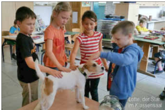
Lotte, der Star im Klassensaal