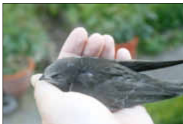
Auf dem Bild ist ein aus einem Nest gefallener Zeiskamer Mauersegler zu sehen.

Zu Beginn der Hitzeperiode saßen deutschlandweit viele fast flügge Jungsegler in den Nestern. Die Vogelart brütet vor allem an hohen Gebäuden unter Dächern und in Nistkästen, die sich mitunter extrem erhitzen. Auf der Suche nach Abkühlung am luftigen Nesteneingang stürzten dann immer wieder Jungtiere ab und blieben hilflos am Boden liegen. Selbst wenn sie den Sturz unverletzt überstehen, sind ihre Überlebenschancen leider gering. Denn im Gegensatz zu anderen Vogelarten füttern Mauersegler ihre Jungen nicht außerhalb des Nestes. Die Pflegestellen und Auffangstationen in der Region, ja sogar bundesweit sind nach dem letzten heißen Wochenende überfüllt mit Pfinglingen und können keine Tiere mehr annehmen.