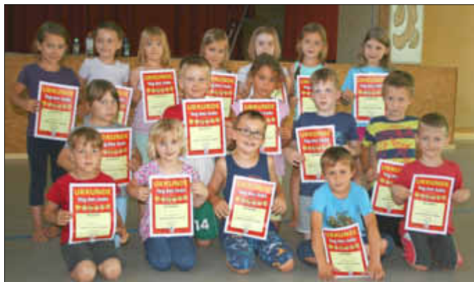
Stolz präsentierten die Schüler die Urkunden nach der Übungsstunde.

Bei hochsommerlichen Temperaturen konnte am letzten Donnerstag, der 1. Vorsitzende bei den Schülern der Grundschule Westheim die Aktion Tag des Judo abschließen. Trotz der erhöhten Temperatur waren die Kids begeistert bei der Sache. Mit Westheim waren insgesamt neun Schulen, die die Trainer des 1. Budoclubs Zeiskam besuchten.