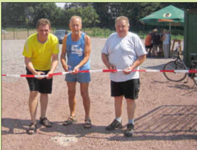
Der Häckselplatz wird offiziell eröffnet