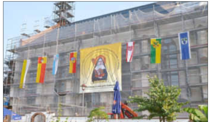
Das aufgehängte Banner sowie die Ortsfahnen am Gerüst der Kirche

Unter dem Motto „Pfarrgarten in Flammen“ hatte der Verein zur Förderung kircheneigener Gebäude die gesamte Pfarreiengemeinschaft St. Hildegard in den Kath. Pfarrgarten in Bellheim eingeladen und ist dabei auf eine sehr große Resonanz gestoßen.