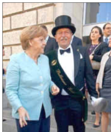
14. Bellheimer Lord, Gerhard Schlindwein, im Gespräch mit der Bundeskanzlerin