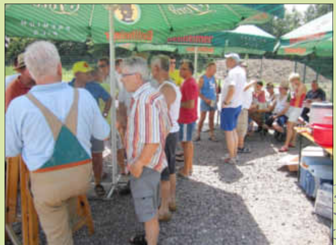
Gut besucht trotz Hitzewelle