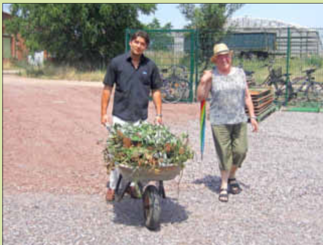
Die erste Fuhrer