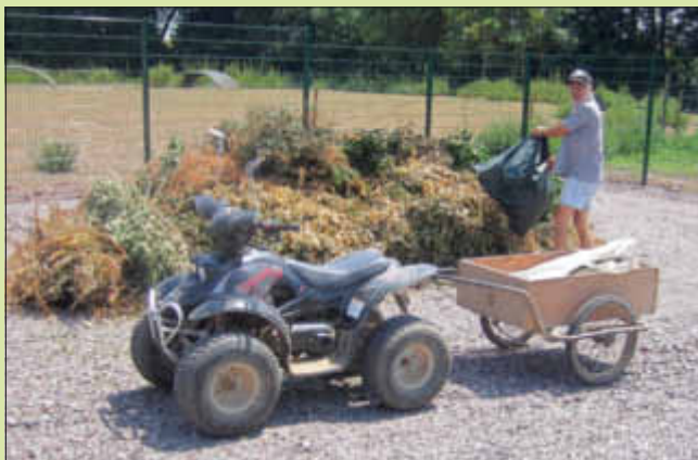
Fahrzeuge aller Art

Zum Teil wurde auch schon das erste Schnittgut gebracht. Der eine lieferte es ganz traditionell per pedes mit dem Schubkarren an, andere fuhren motorisiert vor.