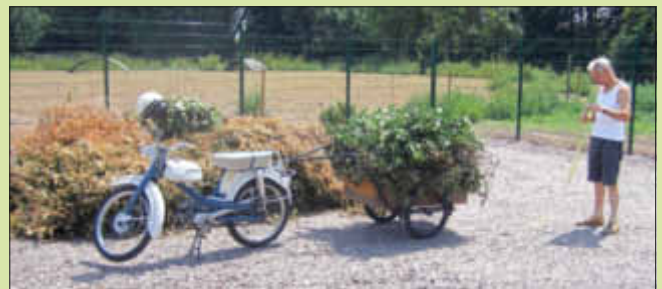
Es sammelt sich einiges an