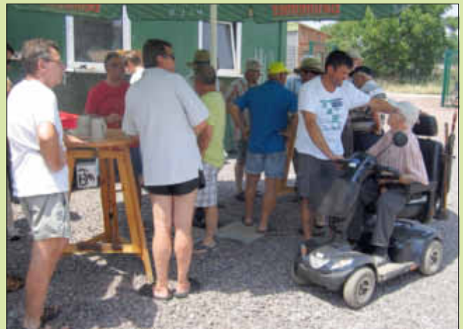
Ohne Schatten fast nicht auszuhalten