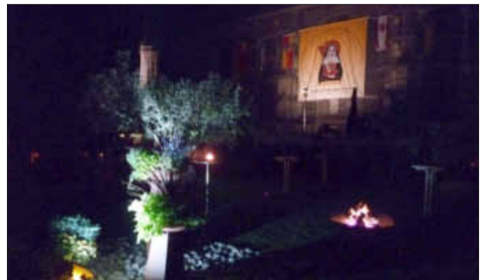
Anheimelnde Atmosphäre im Pfarrgarten

Sehr schnell füllten sich die Plätze im mediterran angelegten Pfarrgarten, der sich einmal mehr als Idylle erwies, was bei den zahlreichen Besuchern großes Staunen hervorrief. Natürlich spielte auch das sommerliche Wetter und zu später Stunde die Feuerstellen, nebst romantisch anmutender Beleuchtung, die eine anheimelnde Atmosphäre schufen, eine gewichtige Rolle. Eigens zu diesem Zweck wurde am Gerüst der Pfarrkirche ein übergroßes Banner mit dem Bild der Hl. St. Hildegard und dem Aufdruck der zu der Pfarreiengemeinschaft zählenden Pfarrgemeinden, wie auch die Fahnen der einzelnen Ortsgemeinden angebracht, was sich sehr eindrucksvoll gestaltete.