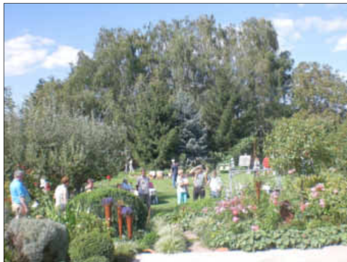
„Offene Gärten & Kunst 2013“, Garten von Fam. Lechner

Am Abend des Kirwesamstags wird der weitläufige, ländliche Garten von Rosemarie und Heinz Lechner (Friedhofstraße 12a) einem Lichtermeer gleichen. Der Garten mit einer großen Pflanzenvielfalt wird durch Glasdekorationen und romantisch anmutender Beleuchtung eine anheimelnde Atmosphäre bieten.