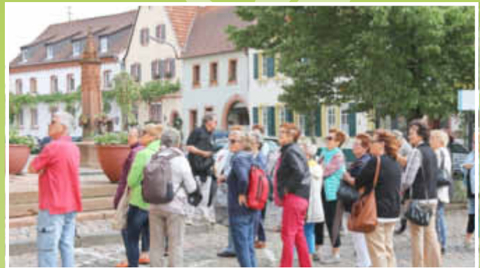
Führung in Edenkoben