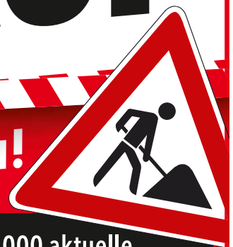
Abb. Modellbeispiele - Zwischenverkauf vorbehalten