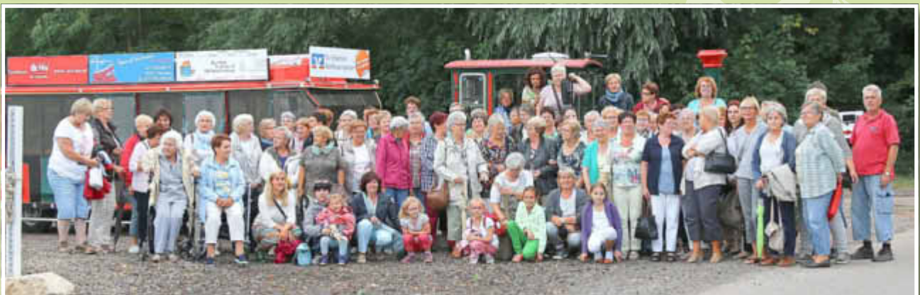
35 Jahre Zeiskamer Landfrauen