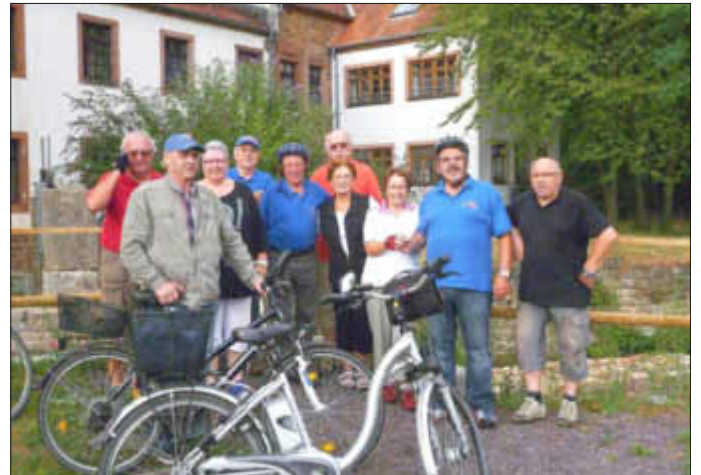
Vor Fischtreppe an der Ludwigmühle

Am kommenden Dienstag, geht's um 18.00 Uhr wieder auf den Drahtesel und wir fahren durch unsere herrliche Natur. Den Einkehrschwung machen wir bei unserem Mitglied in der Gaststätte „Zur Fellach“. Sollte uns doch das Wetter mit Regen versorgen wollen, treffen wir spätestens um 19.00 Uhr in der Fellach.