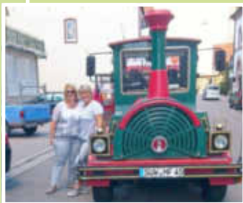
Mit dem Bähnlel unterwegs ...

Danke auch an alle, die zum Gelingen dieses Abends beigetragen haben.