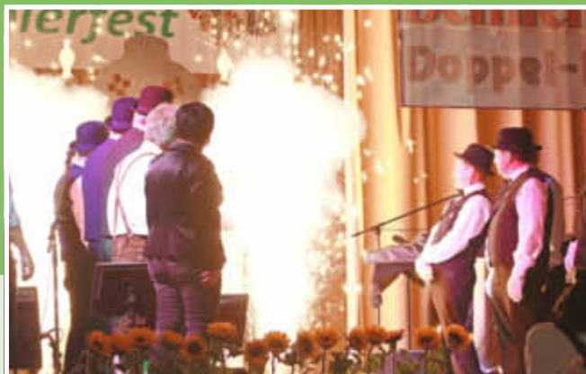
Die Spannung steigt