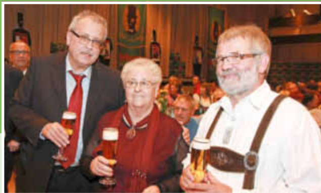
Herzlichen Glückwunsch durch Gemeinde und GBV