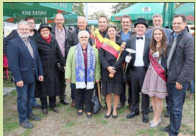
Bürgermeister und Amtsträger aus der Verbandsgemeinde bei der Eröffnung auf dem Kerweplatz

Die Gemeinschaft Bellheimer Vereine bedankt sich auf diesem Weg recht herzlich bei allen freiwilligen Helfern für die Hilfe vor, während und nach dem Bockbierfest, allen Sponsoren (insbesondere unserer Brauerei), allen Teilnehmern des Umzuges, Hoheiten, Vertretern der Politik, Besuchern und Gästen während der Festtage.