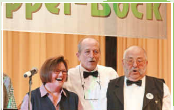
Auch der Lord singt mit