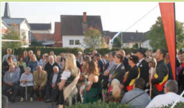
Zahlreiche Gäste bei der Kerweöffnung