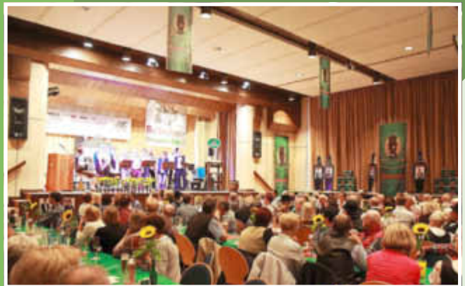
... voll besetzten Schneiderhalle