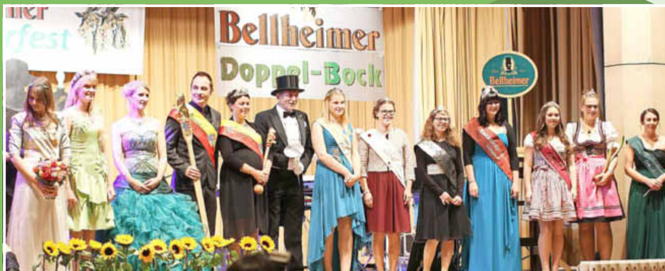
Die Hoheiten zeigen sich „ihren Untertanen“