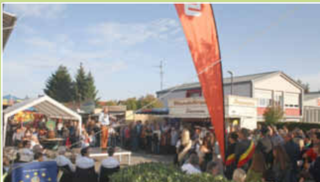
Bürgermeister Ulrich Christmann begrüßt die Gäste