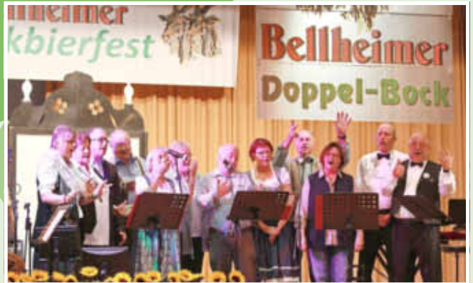
Die Bellemer Hobbysänger in Aktion