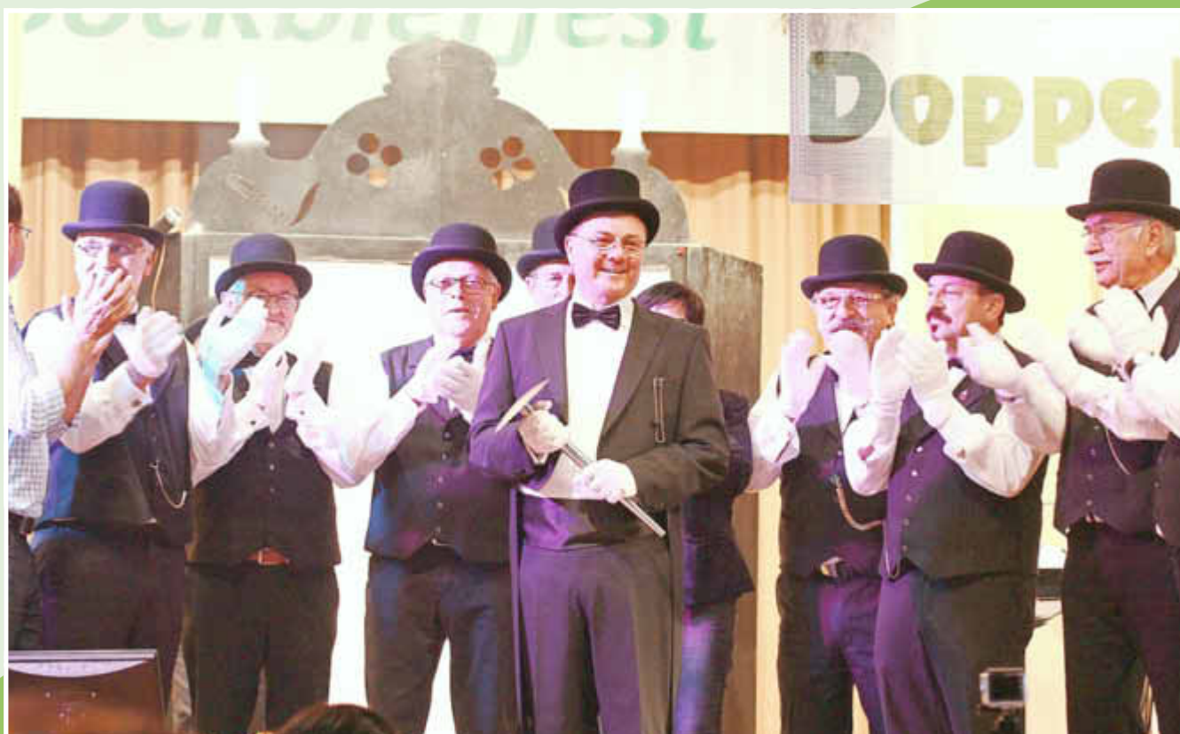
Der Lord wird vom Lordclub empfangen