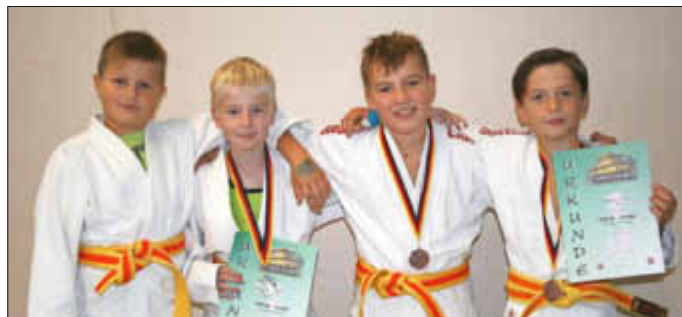
Die U12-Starter präsentierten sich nach dem Turnier.