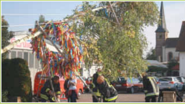
Die Freiwillige Feuerwehr stellt den Kerwebaum