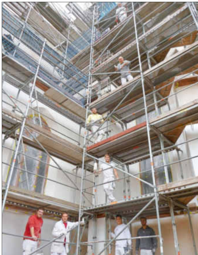
Die Malerarbeiten waren Dank eines großzügigen, zweckgebundenen Zuschusses der Ortsgemeinde Bellheim, erst möglich geworden.