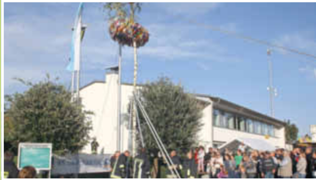
... es ist geschafft!