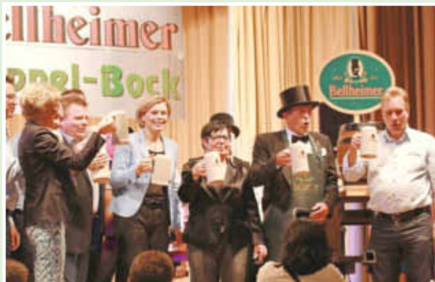
Das neue Bockbier ist angestothen - na dann Prost!