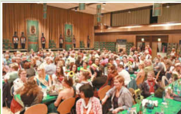
Impressionen aus der ...