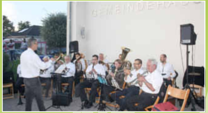
Die Musiker in Aktion