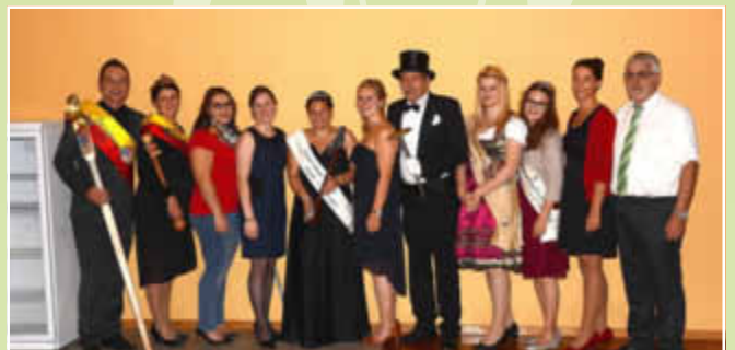
Viele Hoheiten und Exhoheiten waren gekommen