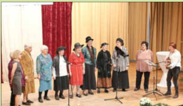
Die Seniorinnengruppe erfreute mit einem selbst gedichteten Liedbeitrag über den Frauenbundwind.