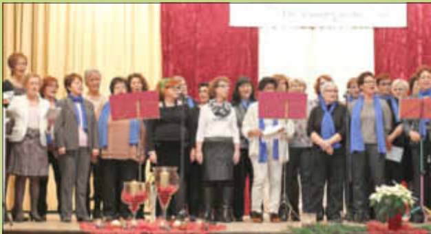
Der Frauenbundchor warf einen Blick auf die heutigen Aktivitäten und ließ ein typisches Jahr im Frauenbund Revue passieren