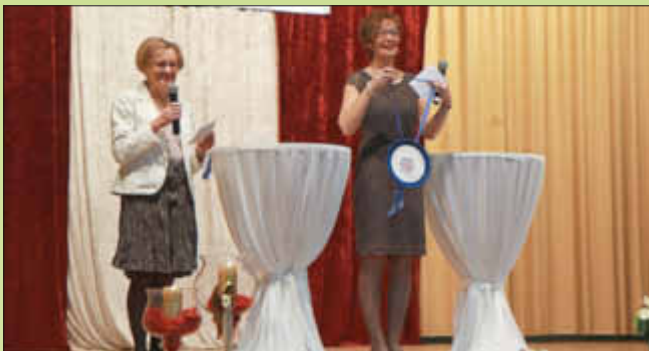
Das Vorsitzendenteam führte unterhaltsam durch das Jubiläumsprogramm

Die Jubiläumsgäste bedankten sich mit viel Lob für den kurzweiligen Nachmittag. Im anschließenden Festgottesdienst in der katholischen Kirche brachten die Frauen ihren Dank vor Gott.