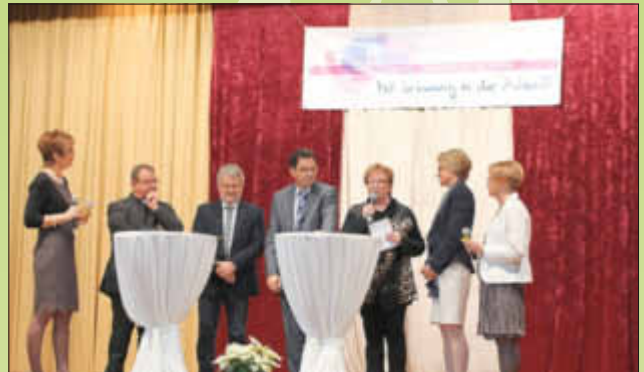
Bei einer lockeren Interviewrunde wurden einige Ehrengäste zu wichtigen Themen befragt: Visionen für die Kirchengemeinde, Ehrenamtsausweis, Ökumene und Frauen in der Politik