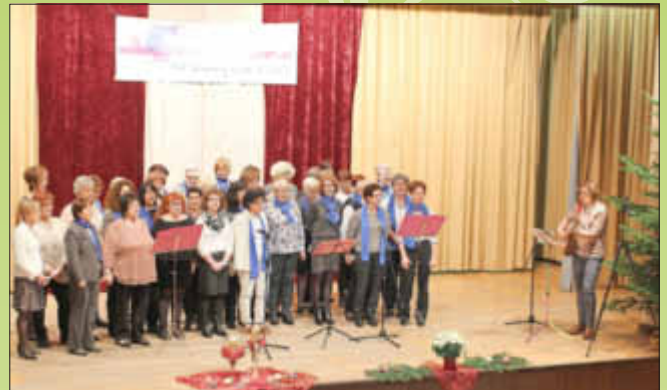
Das Schlusslied „Gut dass wir einander haben“ drückte die Stimmung der Jubiläumsfrauen aus.