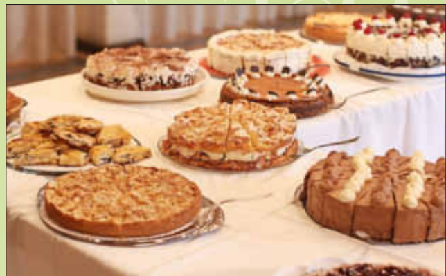
Eine große Auswahl an selbst gebackenen Kuchen gab es am Buffet.