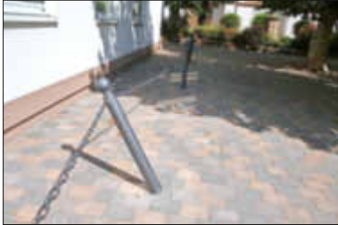
Sachschaden am Abgrenzungsposten auf dem Kirchplatz

Unbekannte haben einen Abgrenzungsposten auf dem Kirchenplatz zur Hauptstraße hin, mutwillig beschädigt (siehe Aufnahme). Der Verursacher wird hiermit aufgefordert, sich im Pfarrbüro zu melden.