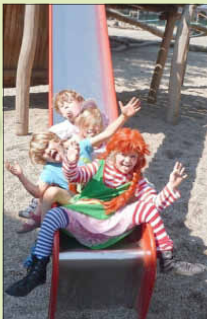
Frech wie Pippi Langstrumpf

Die Kinder bekamen Gefallen daran, in die Rolle der Pippi zu schlüpfen. Was man da alles machen darf?! - die Zunge rausstrecken - die Füße auf den Tisch legen oder auf dem Schrank sitzen.