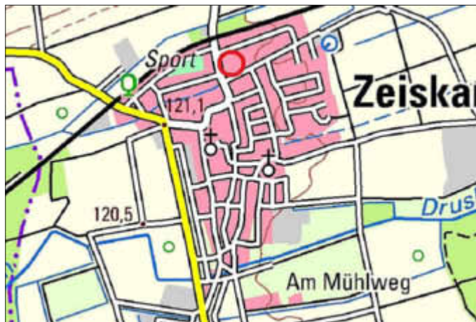
Lage des Plangebietes