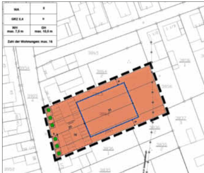
Geltungsbereich des Bebauungsplans o.M.

Der Bebauungsplan wird mit dieser Bekanntmachung rechtsverbindlich.