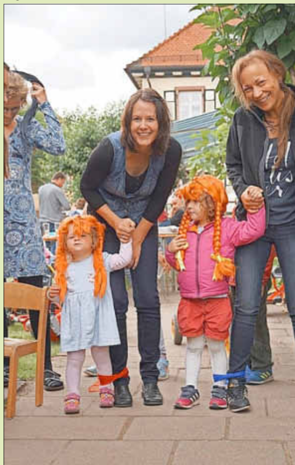
Spiel und Spaß mit Pippi Langstrumpf

Mit schönem Wetter und guter Laune war es ein gelungener Tag. Vielen Dank an alle Helfer.