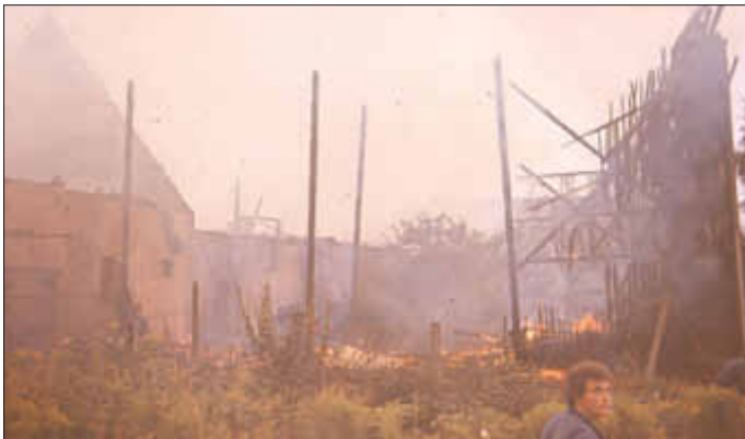
Diese Scheune wurde durch das Feuer fast gänzlich vernichtet