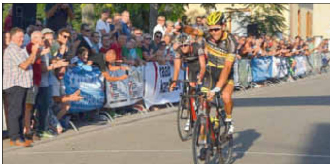
Tolles Publikum und tolle Stimmung bei der Zieleinfahrt des Siegers im Hauptrennen