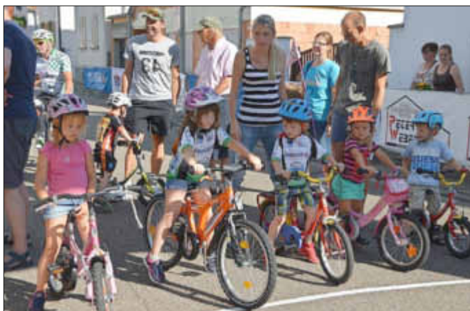
Die „Bambinis“ beim Start