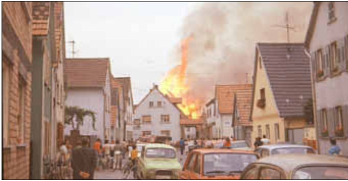
Meterhohe Flammen und Rauchschwaden deuteten schon von weiter Ferne auf die Brandkatastrophe hin

straße über. In sekundenschnelle stand der gesamte Scheunenbereich in meterhohen Flammen. Die in den Stallungen untergebrachten Tiere und Viehbestände konnten größtenteils durch zahlreiche Helfer gerettet werden, mehrere Schweine verbrannten. Am Einsatzort waren insgesamt 15 Feuerwehren mit 35 Fahrzeugen, davon waren 21 im Einsatz.