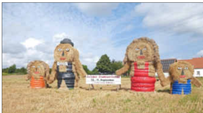
Die Strohpuppen künden alljährlich das Bellemer Grumbeereschd an

15. Bellemer Grumbeereschd vom 10. und 11. September 2016