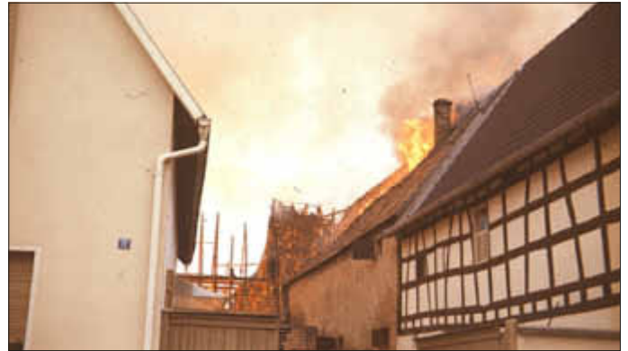
Auch diese Scheune wurde vom Feuer zerstört