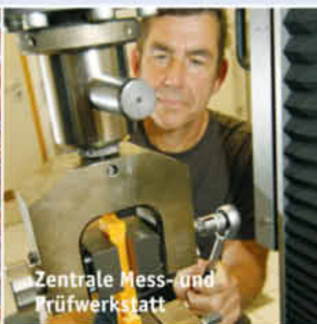
Zentrale Mess- und Prüfwerkstatt