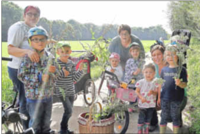
Groß und Klein beim Kräuter sammeln

Am Freitag vor Maria Himmelfahrt waren wieder einige Frauen der kfd unterwegs um Kräuter für den Würzisch zu sammeln. Auch junge Mütter mit ihren Kindern haben mitgeholfen. Die Kleinen waren mit Begeisterung dabei und kannten teilweise schon die eine oder andere Pflanze. Anschließend wurden 100 Sträuße gebunden.