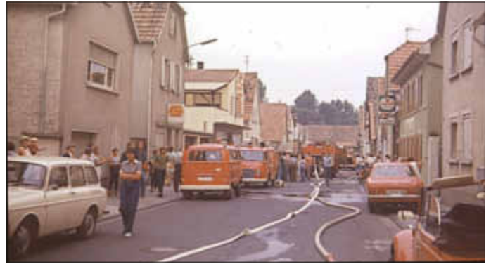
Zahlreiche Einsatzfahrzeuge in der Blumenstraße