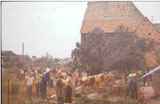
Brandbekämpfung aus dem Gartenbereich mit zahlreichen Schaulustigen