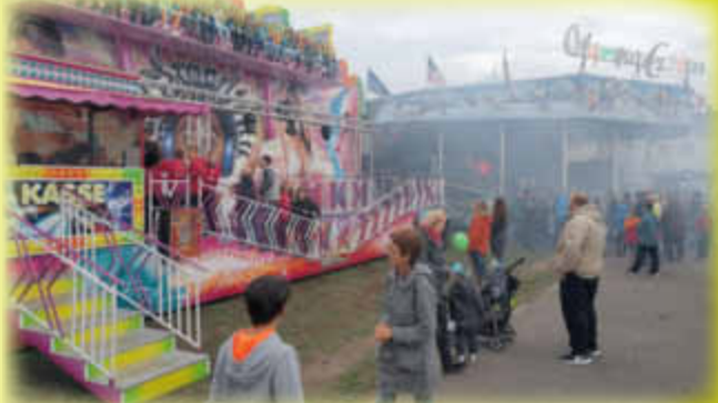
... vom Kerweplatz.