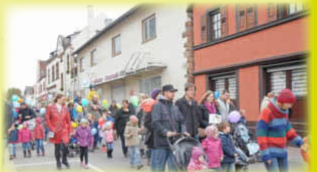
Dank an die Bellheimer Kindergärten.