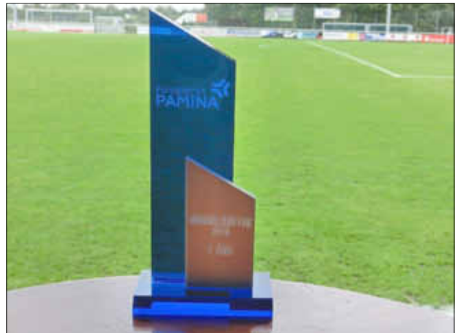
Das ist das Ding: Pokal Ü40-Pamina-Cup