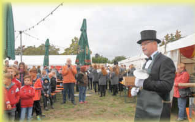
Lord Gerhard spricht zu seinem „Volk“.