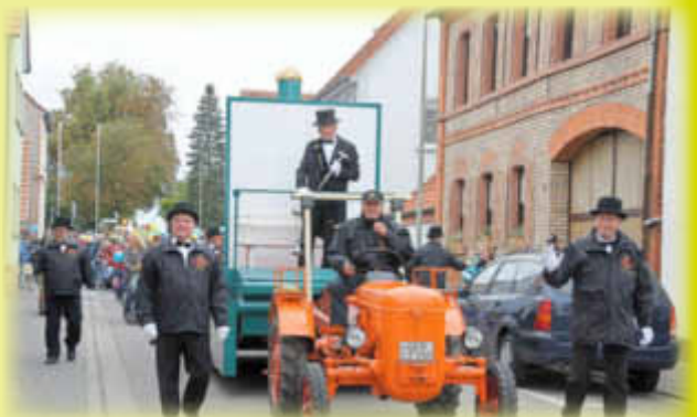
Der Umzug startet.