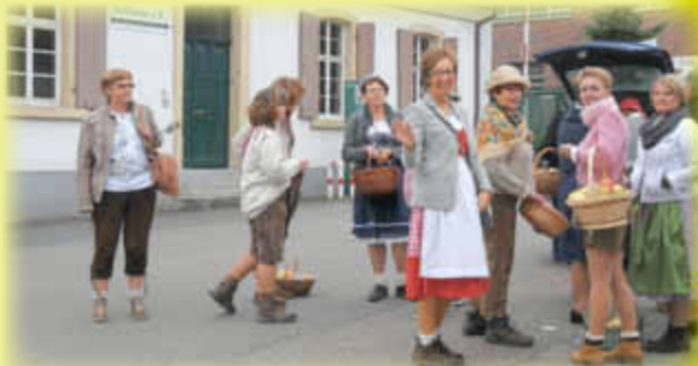
Auch der Frauenbund ist wieder dabei.