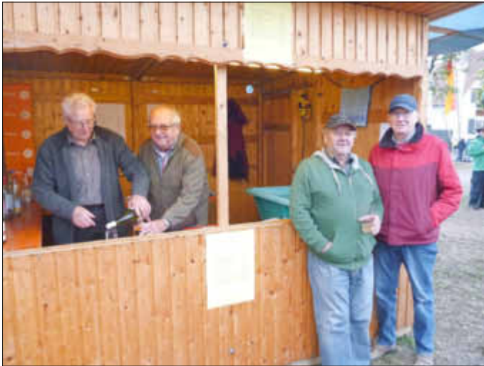
Der Weinstand wurde gut angenommen.