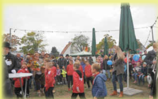
Der Kerweplatz ist gefüllt.