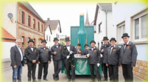
Die Lords unter sich.