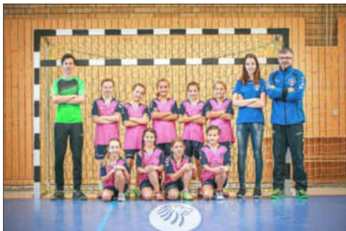
Das Bild zeigt einen kleinen Teil Mädchen der wE-Jugend und einen Teil der Betreuer.