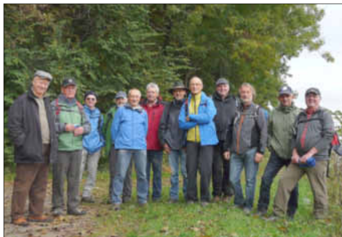
Auf dem Treidlerweg

Nicht weit vom Ortseingang von Hördt trafen wir auf den Treidlerweg, unser eigentliches Ziel.