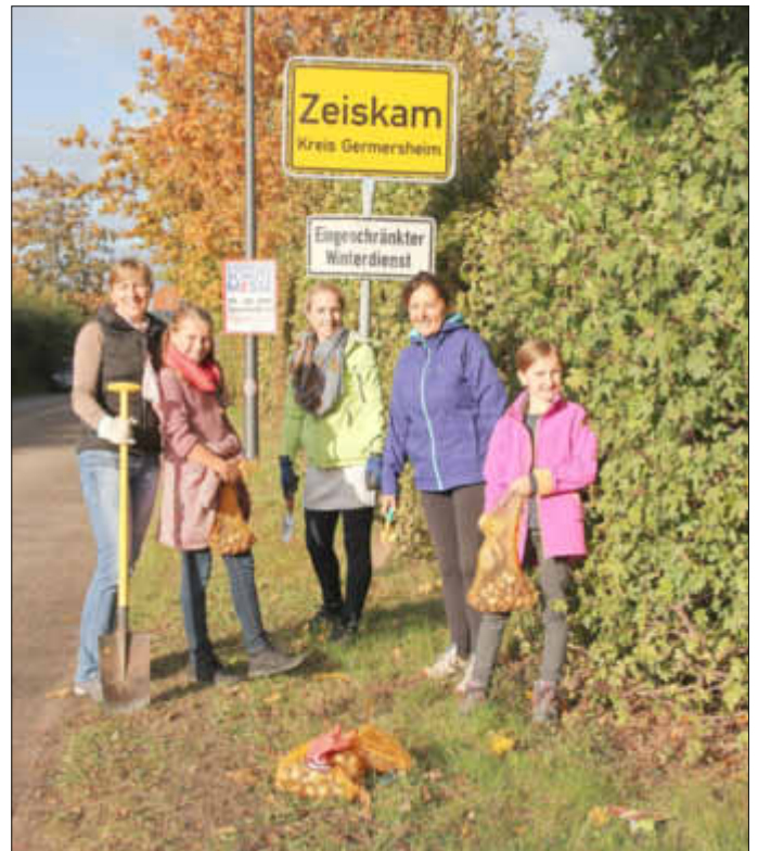
Im Bild einige der fleißigen Helfer