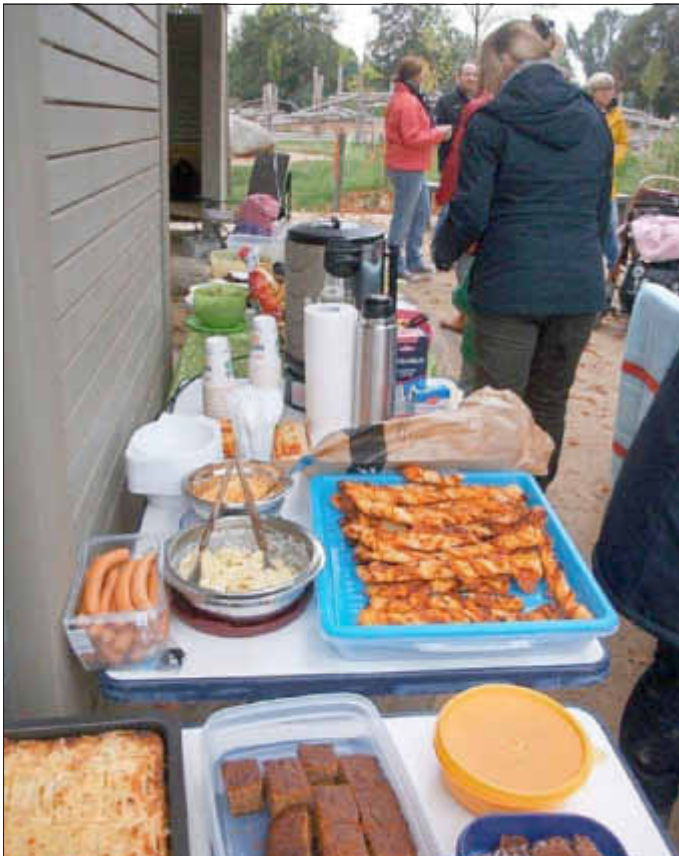
Reich gedecktes Büfett

Mancher Erwachsene musste dann auch feststellen, dass das Klettern auf riesigen, übereinander liegenden Baumstämmen ganz schön anstrengend sein kann. Außerdem waren die Eltern überrascht, wie viel Energie und Ausdauer ihre Kinder an den verschiedenen Stationen an den Tag legten.