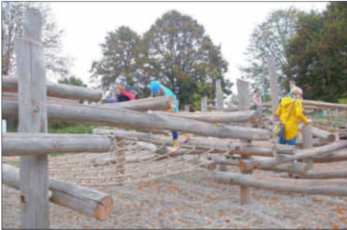
Da sind Kletterkünste gefragt

So konnten wir dann schon kurz nach 10 Uhr insgesamt 45 große und kleine Teilnehmer vor Ort willkommen heißen. Da sich an diesem Vormittag wohl viele potentielle Besucher von der trüben, aber dennoch trockenen Witterung abhalten ließen, war die komplette Spielanlage fest „in unserer Hand“. Wir kletterten, hüpfen und matschten nach Herzenslust. Unsere Kinder hatten ihre Eltern ordentlich in Beschlag genommen und kaum eine, der recht zahlreich vorhandenen Betätigungsmöglichkeiten, blieb am Ende ungenutzt.