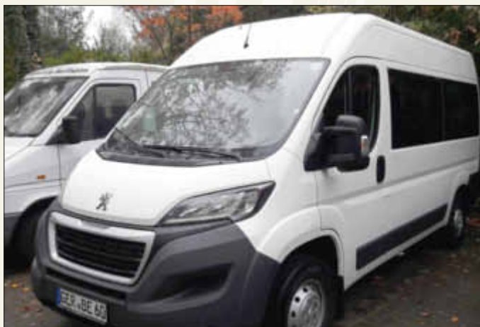
Dieser neue 8-Sitzer (plus Fahrer) kann noch einige ehrenamtliche Fahrer gebrauchen

Er wurde von der Ortsgemeinde Bellheim angeschafft und wird für den ehrenmatlichen Fahrdienst donnerstags zur Verfügung gestellt. Der Bus verfügt über eine Überhöhe, damit man auch drinnen aufrecht stehen kann. Der Bus hat zudem eine ausfahrbare Stufe, so dass man ihn gut betreten und verlassen kann. Im großen Kofferraum können Rollatoren mitgenommen werden.