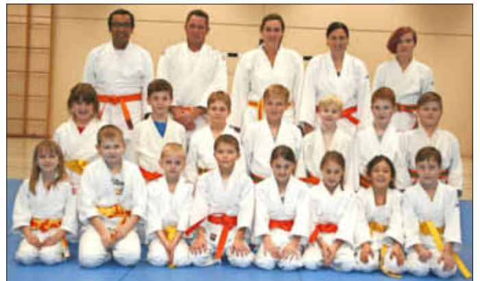
Auch die Buntgurte präsentierten stolz ihren neuen Gürtel.