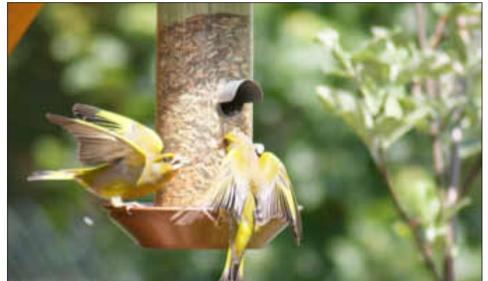
Zwei sich um das Futter streitende Grünfinken. Auch diese Finkenart wird immer seltener!

Eine vielfältige Feldflur mit Obstwiesen, Wildblumen und Feldgehölzen würde auch im Winter vielen Arten Schutz und Nahrungsgrundlage bieten.