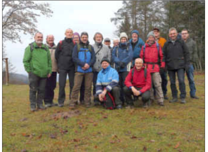
Am Forsthaus Taubensuhl

Im neuen Jahr beginnt die Männergymnastik wieder am 10. Januar.