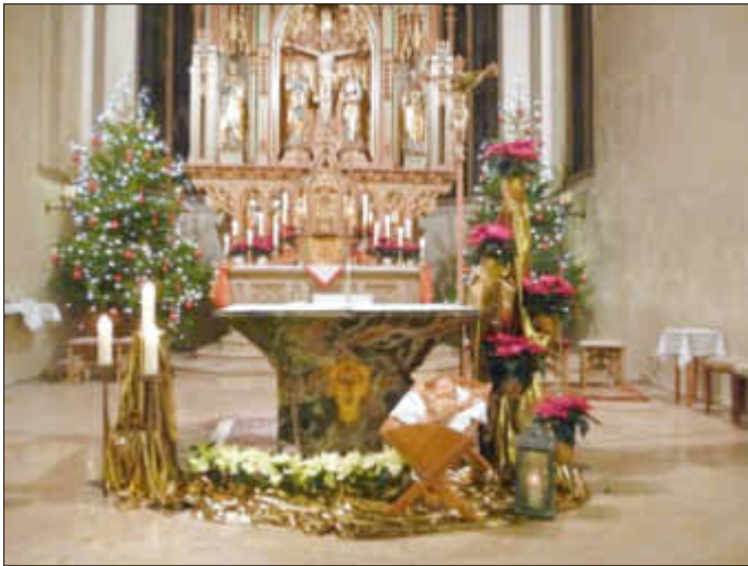
Weihnachtlich geschmückter Chorraum