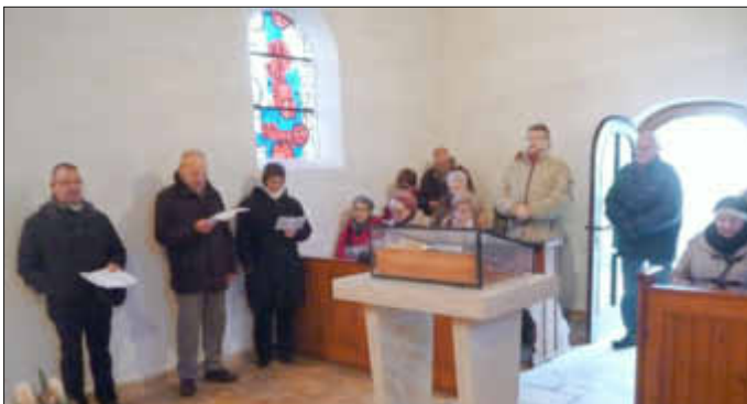
Einige Teilnehmer in der Friedhofskapelle