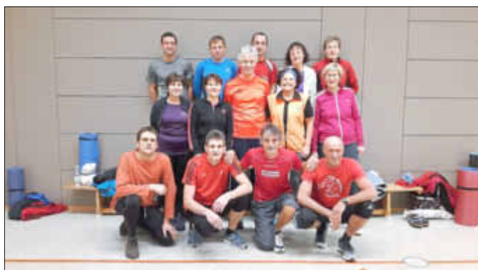
Die Teilnehmer der Funktionsgymnastik freuen sich auf neue Mitstreiter in 2017!