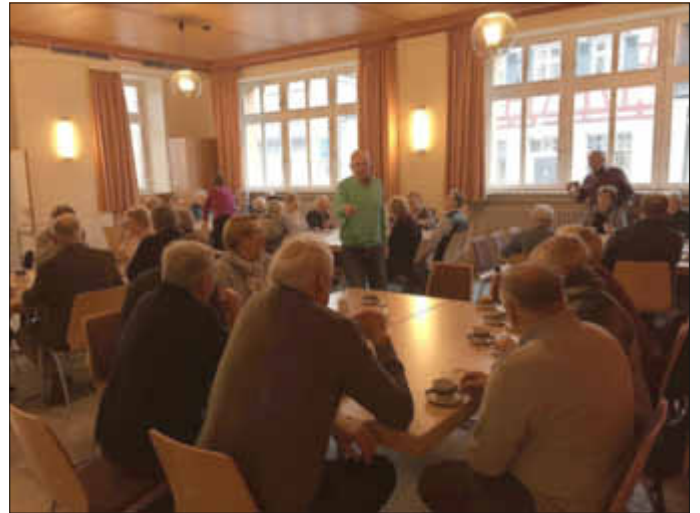
Beim gemütlichen Beisammensein