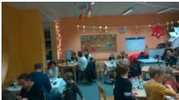
Weihnachtsfeier im Schülerhort IGLUS 2016

Die Planungen sind angelaufen. Bitte merken Sie sich diesen Termin schon jetzt vor.