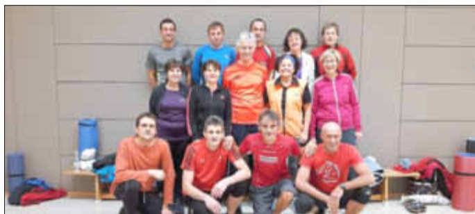
Die Teilnehmer der Funktionsgymnastik freuen sich auf neue Mitstreiter in 2017!

Muskeltraining und Beweglichkeitstraining ist kein lästiges Beiwerk, sondern die notwendige Unterstützung zum Laufen. Jeden Donnerstag (außer an Feiertagen und in den Ferien) treffen wir uns von 18:30 - 19:30 Uhr zur Stärkung der Bauch-, Bein- und Rumpfmuskulatur in der Fuchsbachhalle in Zeiskam. Gezielt werden die Muskelgruppen trainiert und gedehnt, die Ihr beim Laufen benötigt. Bitte bringt eine Gymnastik- oder Isomatte mit.