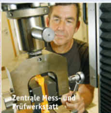
Zentrale Mess- und Prüfwerkstatt