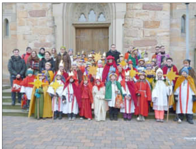
Die Samstagsgruppe vor ihrem Einsatz