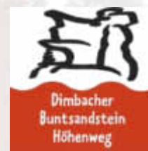
Dimbacher Buntsandstein Höhenweg