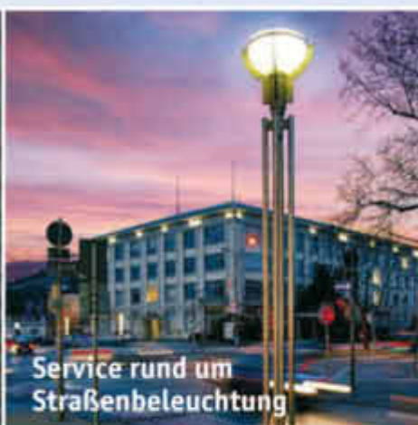
Service rund um Straßenbeleuchtung