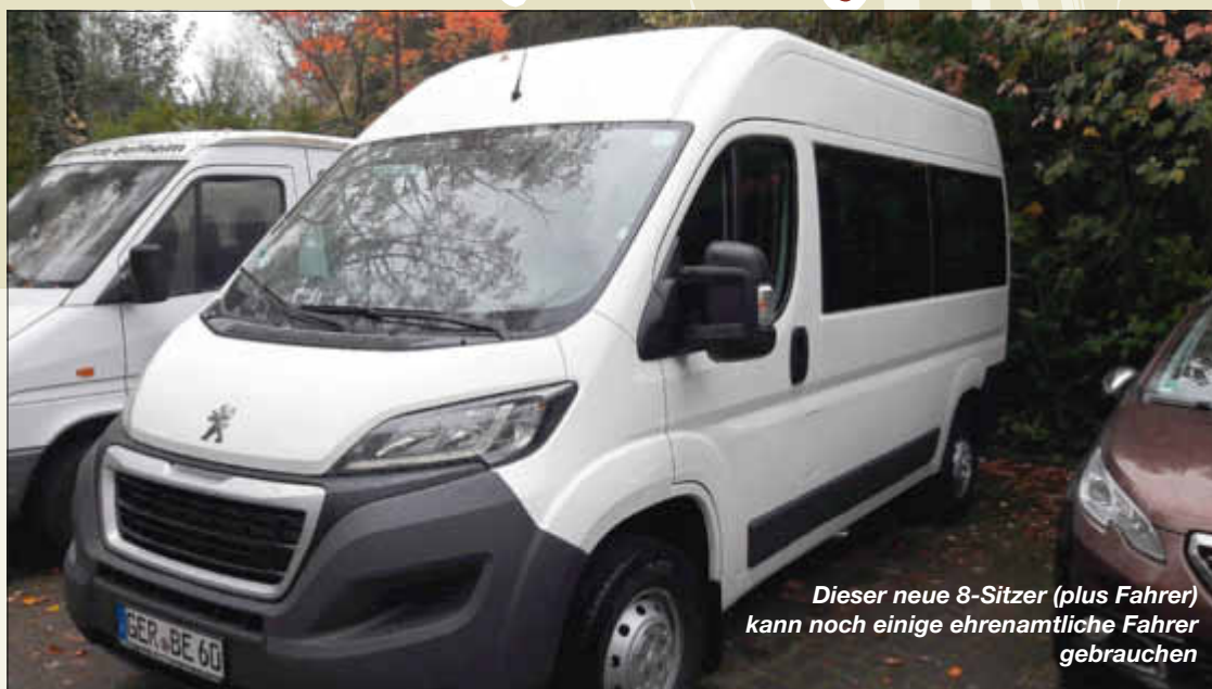
Dieser neue 8-Sitzer (plus Fahrer) kann noch einige ehrenamtliche Fahrer gebrauchen