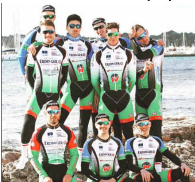
Im Bild die fast komplette Mannschaft auf Malle.