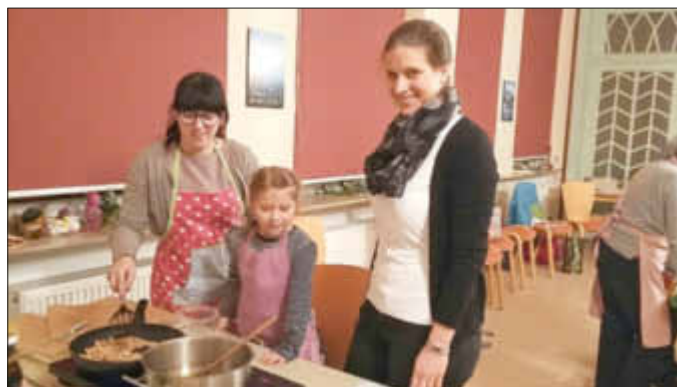
Früh übt sich...