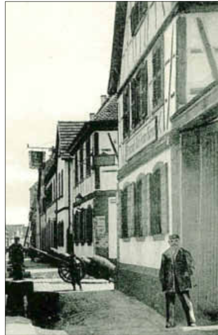
Wirtshaus zum Wolfen

Die ersten „Wirtshäuser“ in Bellheim lassen sich bereits fürs 16. Jahrhundert belegen. Wenn auch noch ohne Schildnamen, waren es konzessionierte Betriebe, die vom Grundherren errichtet oder von der Gemeinde auf Pacht vergeben waren. Wie die Entwicklung der Schank- und Gastwirtschaften, der Herbergen und Straußwirtschaften in Bellheim sich entwickelte will diese Veranstaltung aufzeigen. Bewegte Zeiten erlebten allerdings nicht nur die Baulichkeiten, auch die Betreiber so mancher Bellheimer Lokalität sorgten für mache Geschichte. Von Gewaltexzessen über Tragisches bis Komödiantisches haben die Bellheimer Wirte und deren Gäste nichts