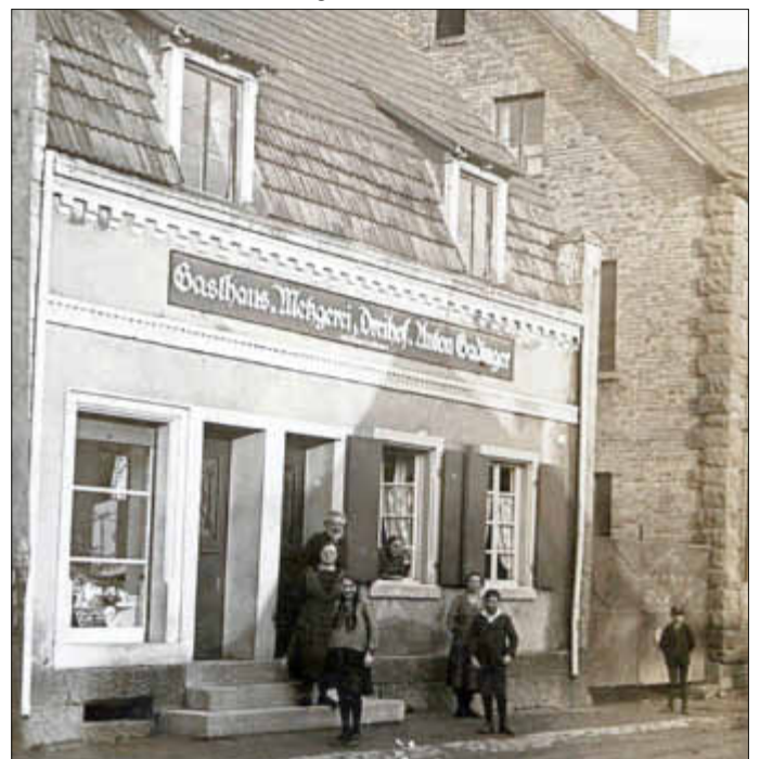
Wirtshaus Dreihof, der Wirt war Anton Gadinger

ausgelassen. Der Vortrag gibt mit Bildern und Texten einen Blick frei auf die zahlreichen Wirtshäuser und Gastwirtschaften, Cafes, Flaschenbier- und Weinhandlungen.