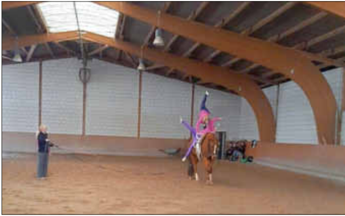
Mit dem neuen Fuchswallach „Rocco di Leo“ haben die Bellheimer Voltigiererrinnen der M-Gruppe ein schon erfahrenes Pferd, mit dem sie sich auf die anstehenden Turniere intensiv vorbereiten können

Die Gruppen sind altersgerecht und nach individuellem Leistungsstand eingeteilt. Derzeit arbeiten 3 Gruppen ein- bis zweimal wöchentlich mit ihren Trainern und Pferden in der Reithalle. Eine neu eröffnete Bambinigruppe nimmt ab sofort Neulinge im Alter 5-7 Jahren auf, die Nachwuchsgruppen 2 und 3 werden durch Kinder zwischen 6 und 8, bzw. 9 und 12 Jahren besetzt. In der Leistungsgruppe, der M-Gruppe, voltigieren die sportlichsten und leistungsfähigeren, bereits erfahrenen Voltigierer auf dem neuen Pferd „Rocco Di Leo“ und bereitet sich auf die ersten Turnierstarts im Sommer vor.