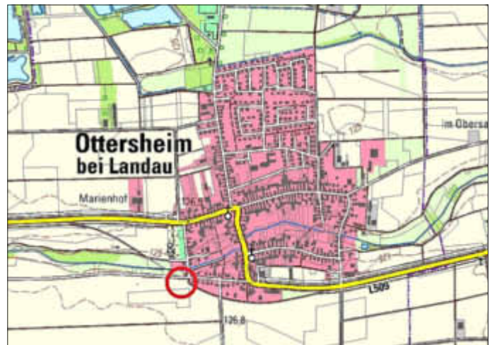
Lage des Geltungsbereichs im Ort