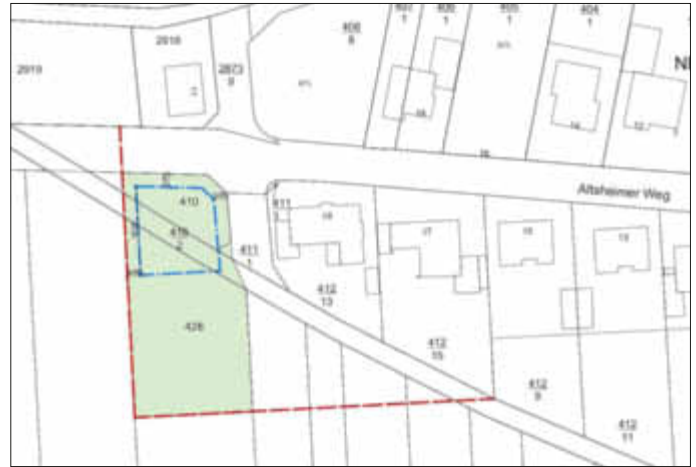
Planzeichnung als Bestandteil der Satzung

Es wird auch darauf hingewiesen, dass gemäß § 3 Abs. 2 BauGB ein Antrag nach § 47 der Verwaltungsgerichtsordnung unzulässig ist, soweit mit ihm Einwendungen geltend gemacht werden, die vom Antragsteller im Rahmen der Auslegung nicht oder verspätet geltend gemacht wurden, aber hätten geltend gemacht werden können.