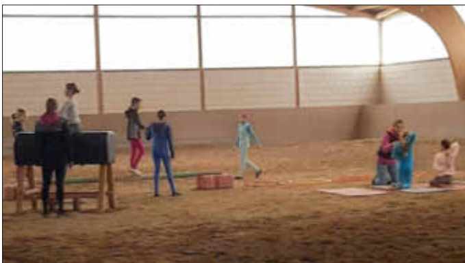
Turn- und Aufwärmtraining läuft parallel zur Arbeit mit dem Pferd für alle Voltigierer

„Der Spaß steht im Vordergrund, die Motivation, mal mit den älteren Voltigierern als Vorbilder zusammen zu arbeiten, ist riesengroß!“ Die Voltigiergruppen des Reitvereins Bellheim starten regelmäßig erfolgreich auf regionalen Turnieren. In den Gruppen üben zwischen 8 und 10 Voltigierer gemeinsam den Gruppensport aus. Turnen, Kräftigen, Haltungsförderung, Spannung und Dehnung, Tanzen wird auf dem Boden, am Übungsbock und am Pferd ausgiebig trainiert.