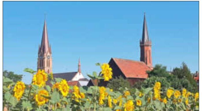
3. Platz: Bild „Bellheimer Kirchen mit Sonnenblumen“ von Felix Bus

Der Tourismusverein gratuliert den Gewinnern nochmals recht herzlich und bedankt sich bei allen Teilnehmern für die Zusendung der zahlreichen Bildern.