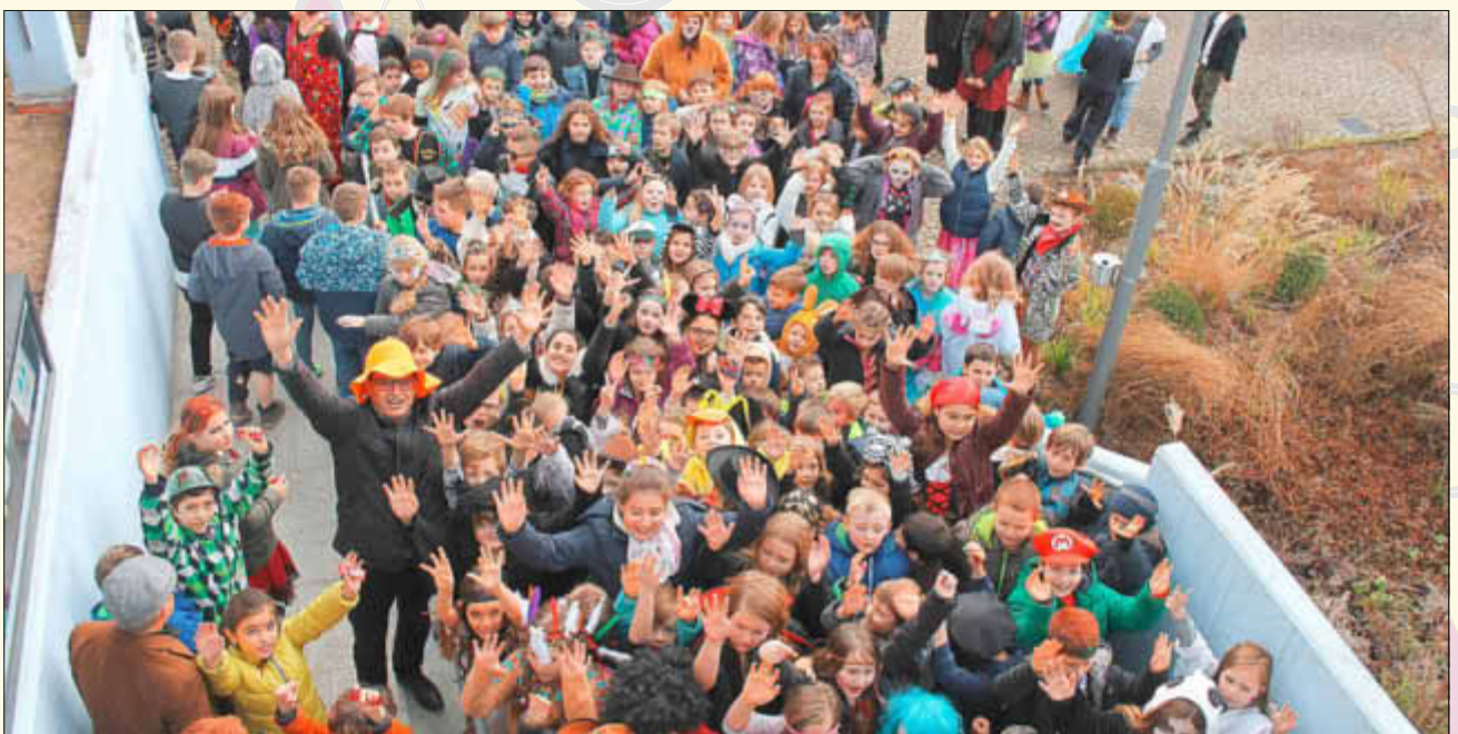
Gleich gibt es Süßigkeiten