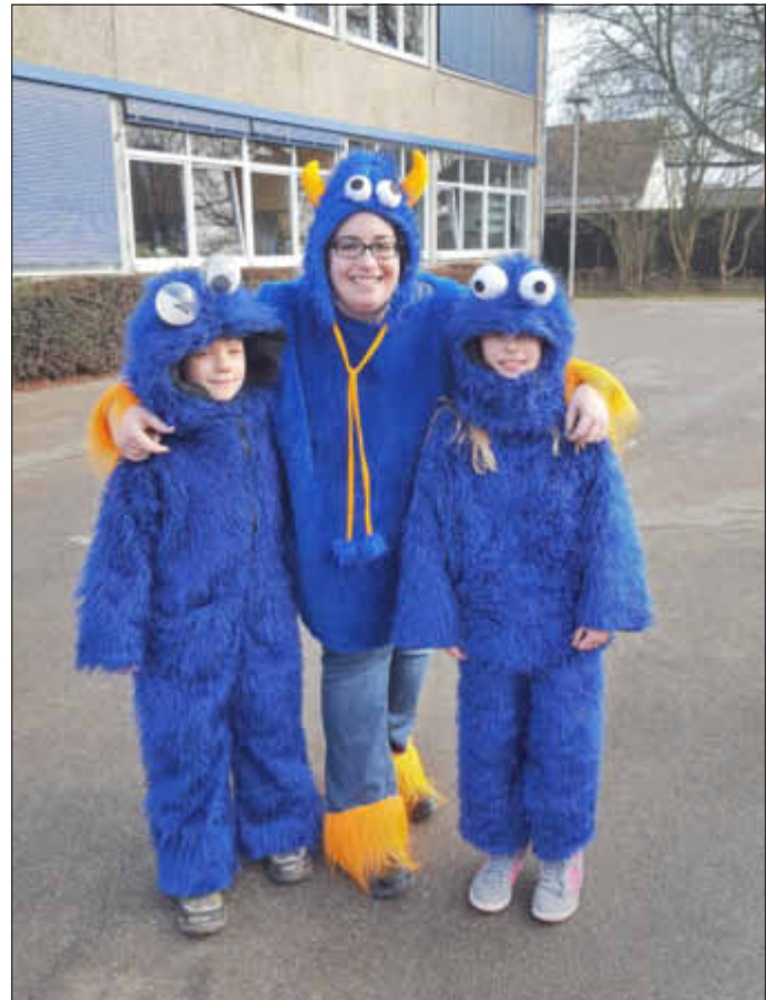
Drei Krümelmonster haben Spaß