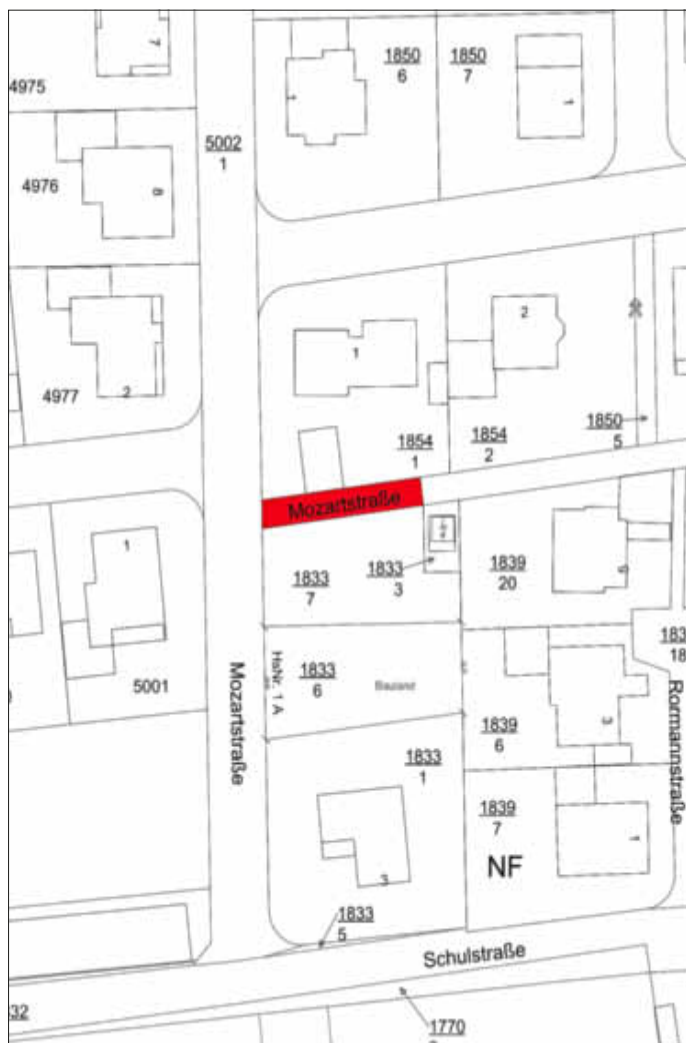
Geltungsbereich der Widmung