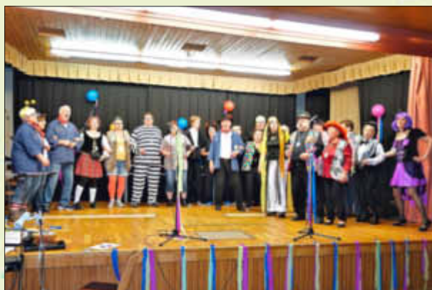
Akteure und Helferstab beim Finale