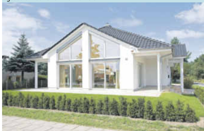
BU: Offen und ebenerdig - ein Bungalow bietet eine Menge Wohnkomfort.

Der Bungalow ist ein Haus, das den Ansprüchen seiner Bewohner in jedem Lebensalter gerecht werden kann. Kein Wunder also, dass er – ob rechteckig, L- oder winkelförmig – eine Renaissance erfährt. Umgeben von einem ansprechenden Garten wird der Bungalow zum perfekten Rückzugsort.