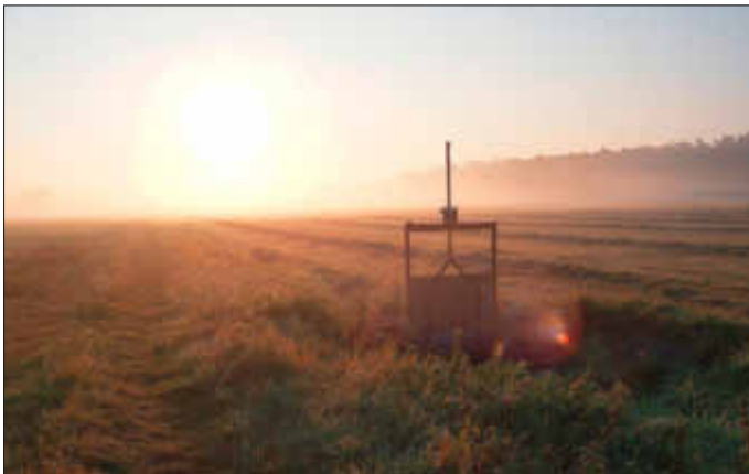
1. Platz: Bild „Holzwiesen im Morgendunst“

Bürgermeister Dieter Adam mit den glücklichen Gewinnern des Fotowettbewerbs: Peter Mees (1. Platz; Bildmitte) und Felix Bus (3. Platz; rechts im Bild)