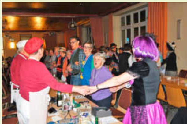
Es wurde gesungen und kräftig geschunkelt