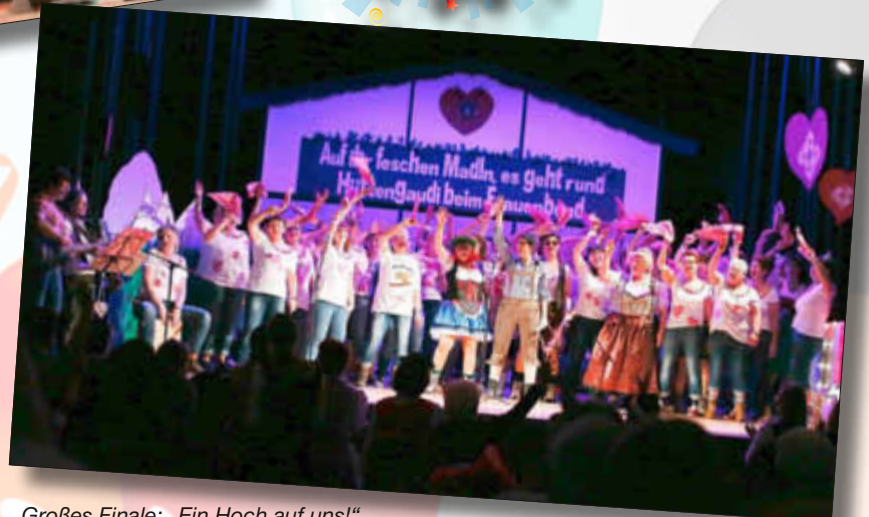
Großes Finale: „Ein Hoch auf uns!“