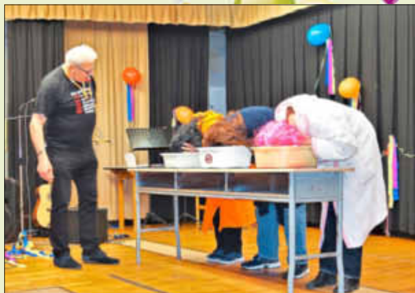
Abendtoilette vor dem Schlafengehen