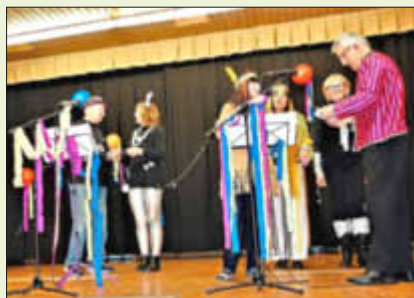
Die Fun Sing Payers erhalten ihren verdiensten Orden