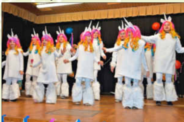
Die Showtanzgruppe S'Eck