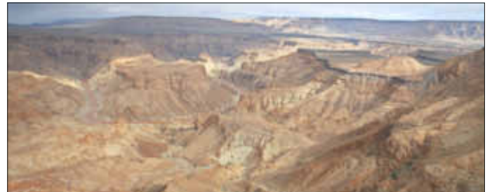
Fish River Canyon

16 00 km kreuz und quer in 100 Tagen mit einem Off-road-Fahrzeug und Zelt durch eine beeindruckende Landschaft. Grandiose Dünen, einsame Küsten am Atlantischen Ozean, ungezähmtes Kaokoveld, bizarre Gebirge, gigantische Nachthimmel, eine aufregende Flora und Fauna. Manchmal tagelang ohne jeglichen menschlichen Kontakt auf Sand- und Kiespisten, über steinige Gebirgspässe in Hitze und nächtlicher Kühle. Ein Film- und Fotovortrag, der auch die weniger ausgetretenen Pfade zeigt, in die Einsamkeit dieses Landes eintaucht mit ungewöhnlichen Aus- und Einblicken und jeden verzaubert, der Natur und weitgehende Ursprünglichkeit liebt.