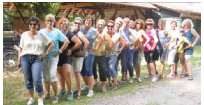
So sportlich und durchtrainiert sehen Radfahrerinnen aus!