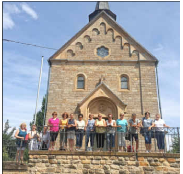
Zwischenstopp: nach Besuch der Kirche