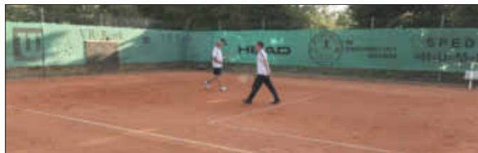
Dorfmeister „Die Pfarrauer“

Wir bedanken uns bei allen Spielern und Mannschaften, die durch ihr Engagement zu einem gelungenen Turnier beigetragen haben und hoffen, dass sie im nächsten Jahr auch wieder mit dabei sind.