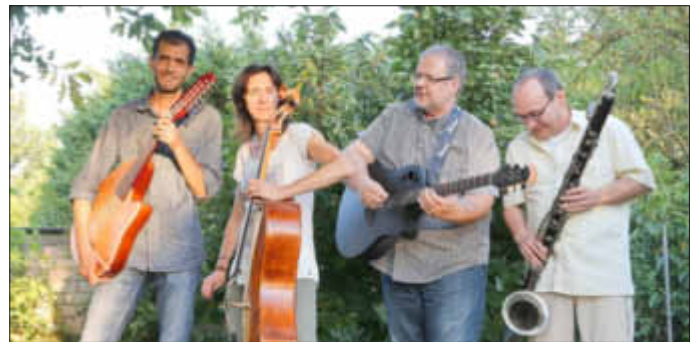
„Straight to the heart“