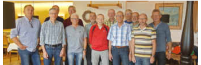
Gruppenbild im Hotel

Die Resonanz der Teilnehmer war überaus positiv. Hotel, Touren, Berge, Landschaft und vor allem das gesellige Beisammensein einer homogenen Gruppe waren hierfür ausschlaggebend.