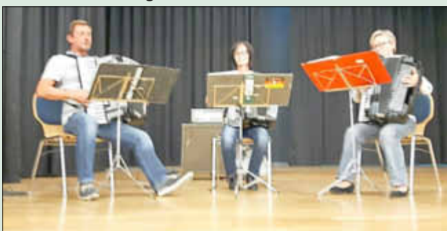
Gruppe des Harmonikaorchesters