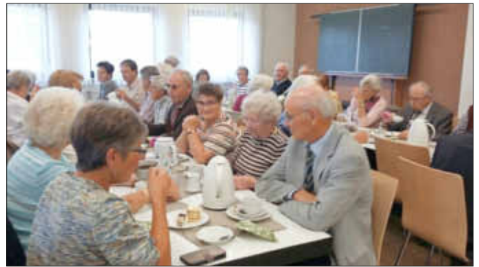
Gemütliches Beisammensein bei Kaffee und Kuchen