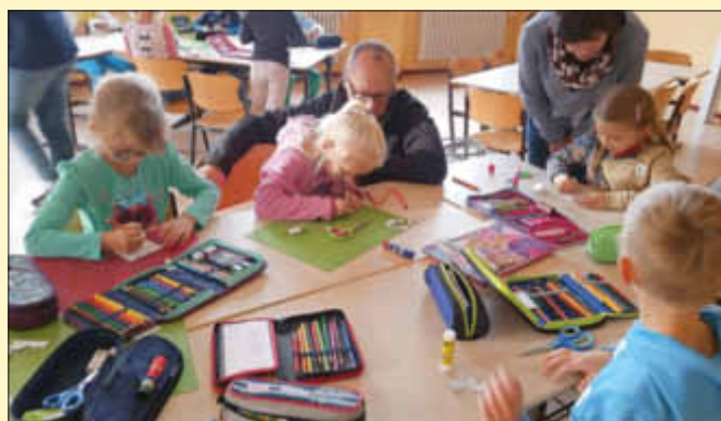
Mit Eifer beim Fingerpuppenbasteln