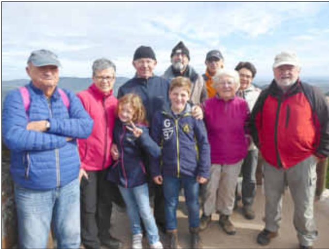
Auf dem Aussichtsturm