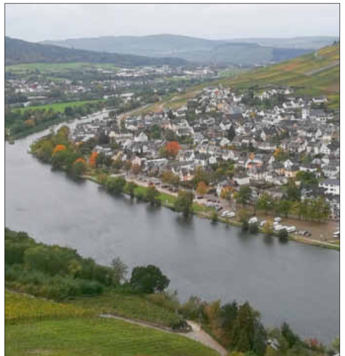
Blick über die Mosel