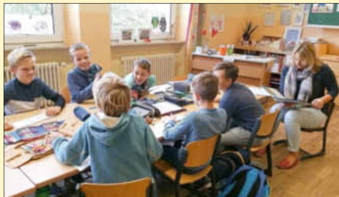
Tolle Lesezeichen sind in Arbeit!