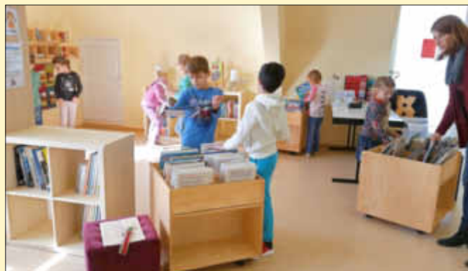
Unsere Jüngsten erkunden mit großer Begeisterung die Ausleihbücherei