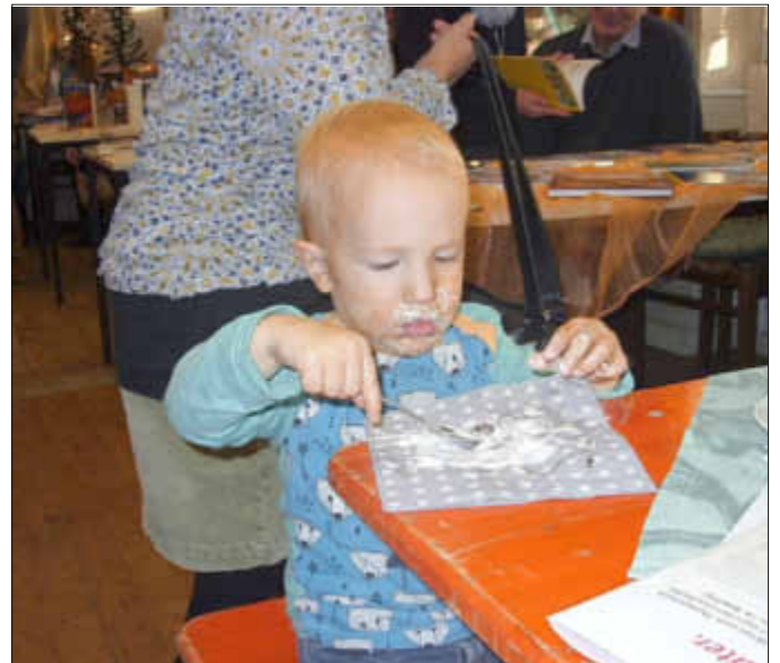
... und künftige Leser