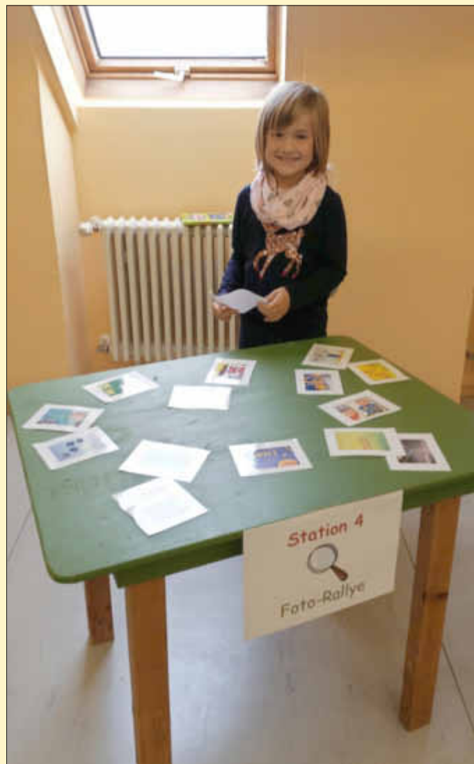
Auf los geht's los. Die Rallye beginnt!

Unsere Bücherei, ein schöner Beitrag zur Schulentwicklung und eine hervorragende Motivation für unsere Schüler!