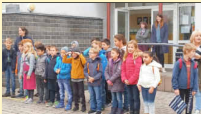
Gemeinsamer Auftakt im Schulhof