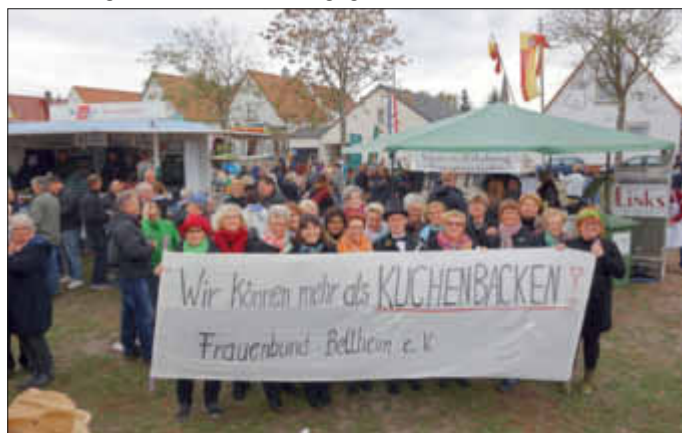
Viele Frauen und nur 1 Mann

In diesem Jahr hat sich der Frauenbund gleich 3-mal an der Bellemer Kerwe beteiligt. Es ging los am Freitag mit dem Bockbierfest in der Festhalle. Hier sorgten 7 Frauen, für die Essensausgabe. Flexibel, wie wir nun mal sind, wurde dabei auch auf Extrawünsche einzelner Gäste eingegangen, wie z.B. Haxen fachmännisch geteilt. Kaum hatten wir dieses Event hinter uns gebracht und ein paar Stunden geschlafen, hieß es am Samstag schon wieder auf zum Kerweumzug. Mit 23 Frauen und einem Banner „Wir können mehr als Kuchenbacken!“ liefen wir mit und ließen die staunende Bevölkerung wissen, dass wir außer Kuchenbacken noch unzählige andere Dinge, wie Wandern im Pfälzer Wald, Radtouren, Lagerfeuer, Filmabende usw. können. Nach dem Umzug saßen wir dann noch gemütlich auf dem Kerweplatz zusammen. Doch einige von uns mussten schon bald wieder aufbrechen, denn jetzt hieß es am Abend bei den „Skyriders“ in der Festhalle den Cocktailstand zu betreiben. Gekonnt wurden hier von den Frauenbund-Frauen die Cocktails gemixt. Wie man sieht, der Frauenbund ist vielfältig hat mal wieder alles gegeben!