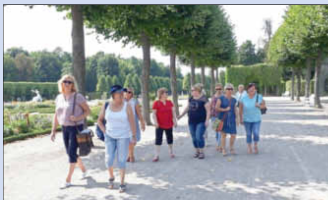
Im herrlichen Schlossgarten