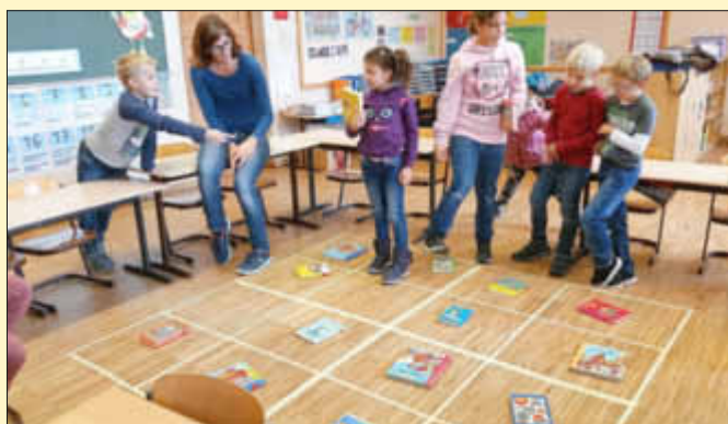
Hier ist logisches Denken gefragt. Alle helfen mit.