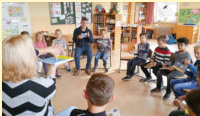
Bewegen mit Büchern, welch ein Spaß!