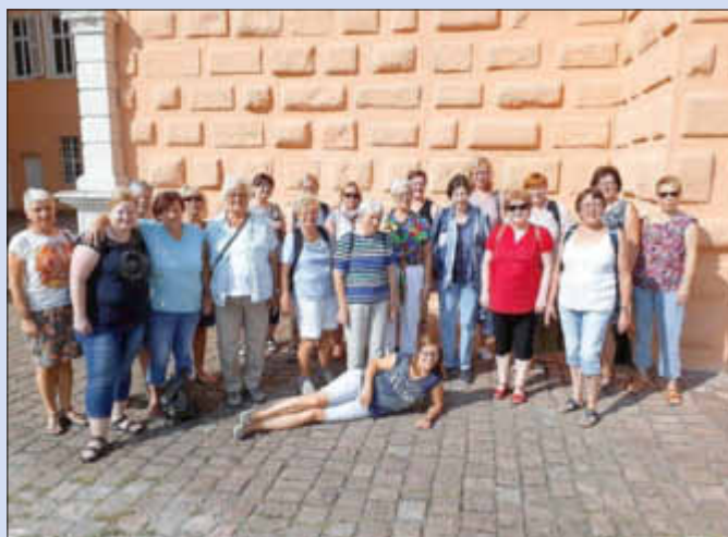
Vor dem Schloss