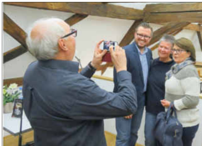
Gruppenbild mit Autor