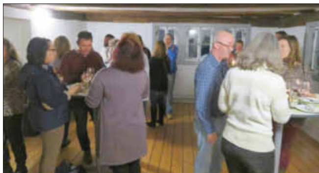
Angeregte Gespräche nach der Lesung