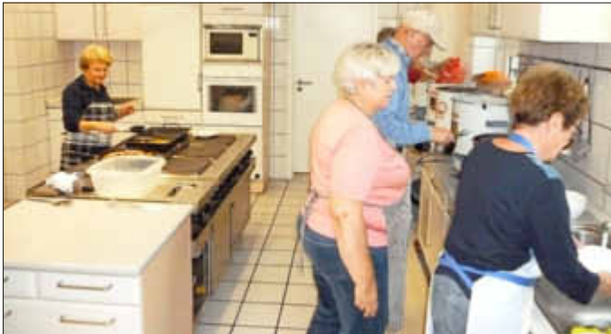
Die Helfer in der Küche hatten alle Hände voll zu tun