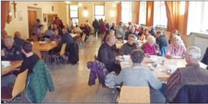
Allen schmeckte es vorzüglich