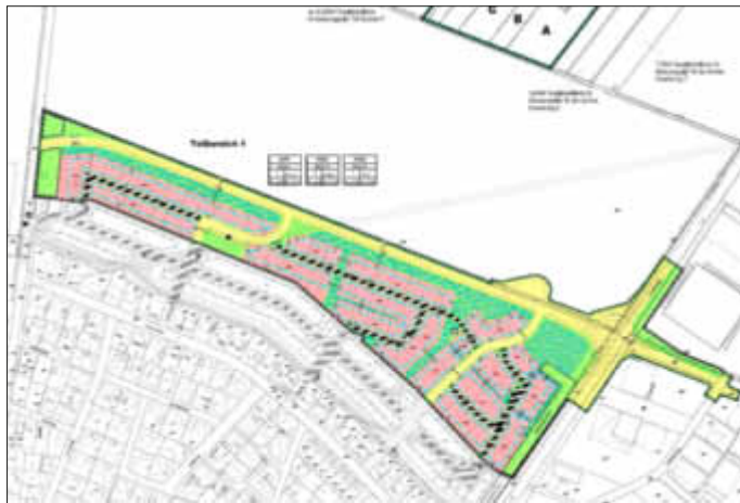
Geltungsbereich des Bebauungsplans o.M.

Diese Bekanntmachung nach den Rechtsvorschriften des § 10 Abs. 3 BauGB beinhaltet auch die förmliche Bekanntmachung der gestalterischen Festsetzungen nach § 88 Abs. 6 der Landesbauordnung (LBauO) Rheinland-Pfalz. Der Bebauungsplan mit Begründung liegt gemäß § 10 Abs. 3 BauGB ab sofort bei der Verbandsgemeindeverwaltung Bellheim, Zimmer 7 (Bauabteilung im Nebengebäude), während der üblichen Dienststunden öffentlich aus. Diese sind Montag bis Freitag von 08.00 - 12.30 Uhr, zusätzlich Montag und Donnerstag von 14.00 - 16.00 Uhr sowie Mittwoch von 14.00 - 18.00 Uhr. Jedermann kann dieses Planwerk einsehen und über seinen Inhalt Auskunft verlangen. Der Bebauungsplan wird mit dieser Bekanntmachung rechtsverbindlich.