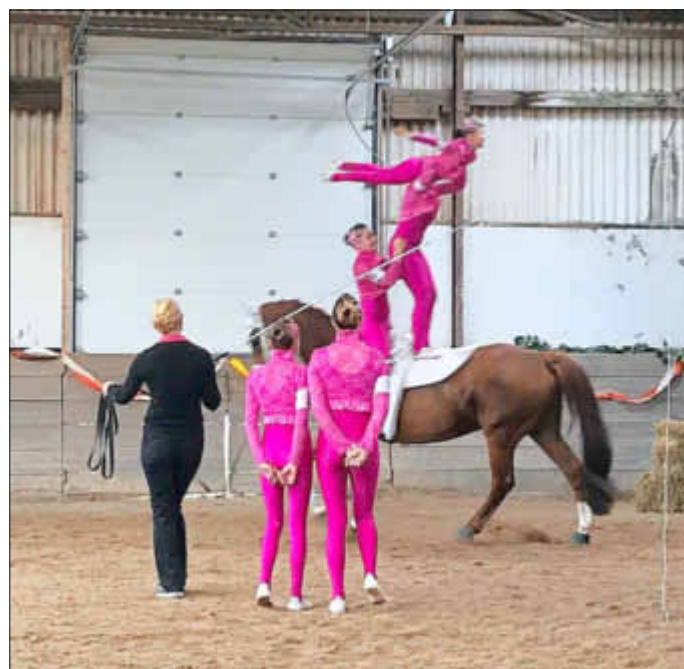
Die Mannschaft bei einer schweren Dreierübung im Galopp auf ihrem Pferd Rocco

Das Voltigieren im Reitverein Bellheim findet als Gruppensport in vier alters- bzw. leistungsdifferenzierten Gruppen an drei Tagen in der Woche statt. In der Gruppe der 5- bis 8-jährigen Turner können noch vereinzelt Kinder aufgenommen werden. Eine Schnupperstunde ist kostenlos möglich. Kontakt gerne bei Sabine Schwarz unter 07272/71419.