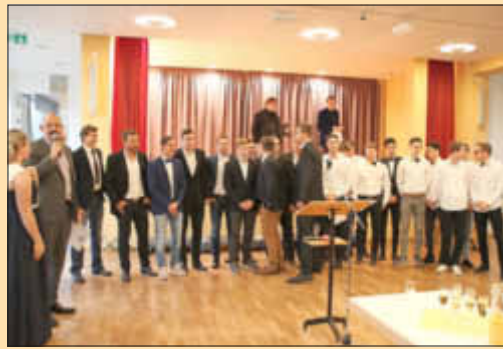
A-Jugend und 1. Mannschaft des TuS Knittelsheim