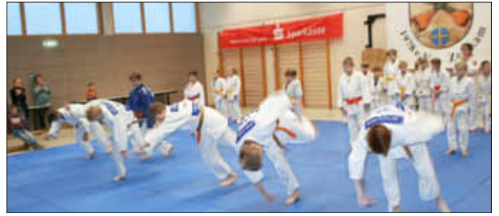
Fast synchron zeigten die Jungs den Freifall