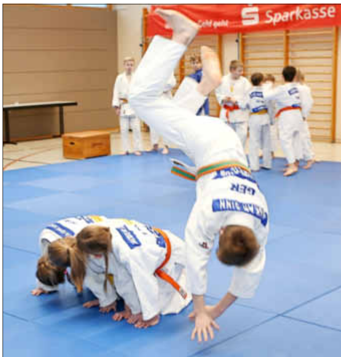
Flugrolle über die Hindernisse