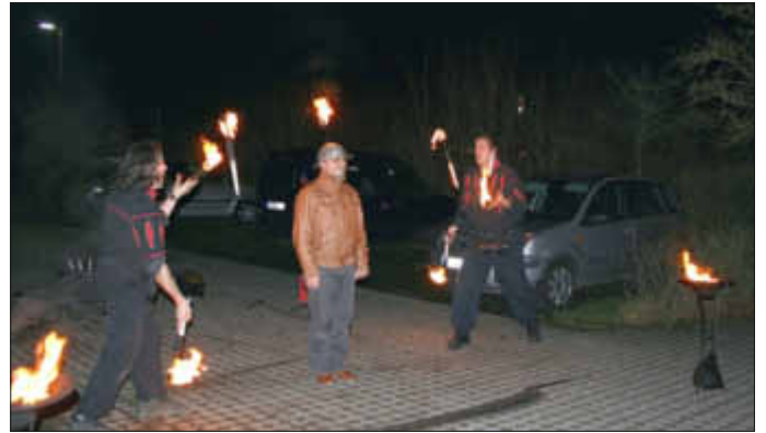
Die Feuershow begeisterte alle.