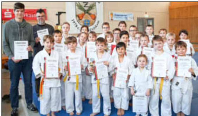
Die meisten Geehrten präsentieren ihre Trophäen dem Fotografen.