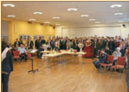
Gut besuchter Neujahrsempfang