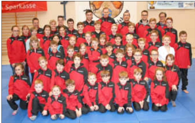
Die Aktiven präsentieren ihr neues Outfit