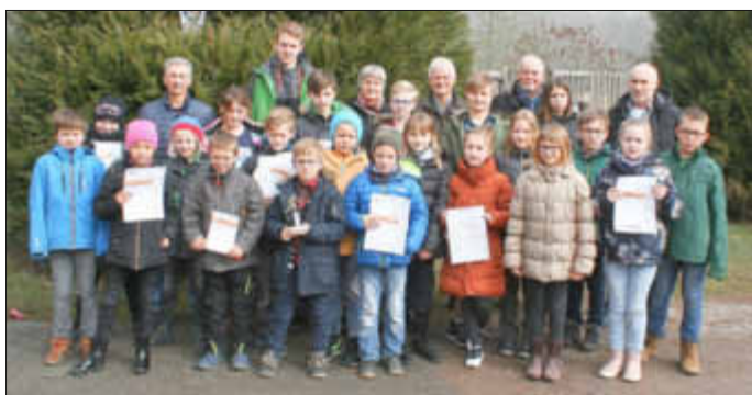
Die anwesenden Sportabzeichenteilnehmer ließen sich nach der Verleihung ablichten.