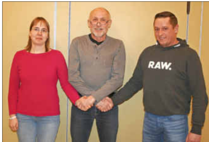
Per Handschlag begrüßte der Vorsitzende die neuen Vorstandsmitglieder.