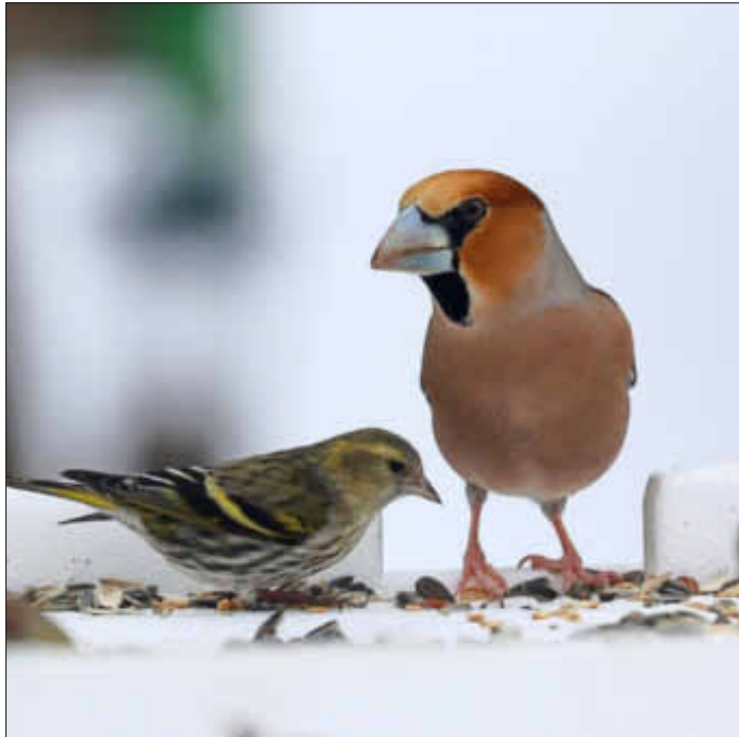
Die auf dem Bild zu sehenden Finken, ein Kernbeißer und der deutlich kleinere Erlenzeisig, sind in der Regel Wintergäste aus dem hohen Norden!

Es ist zu hoffen, dass die eisigen Temperaturen mit teilweise geschlossenen Eisdecken auf den Gewässern den einheimischen Eisvögeln nicht zu sehr zugesetzt haben.