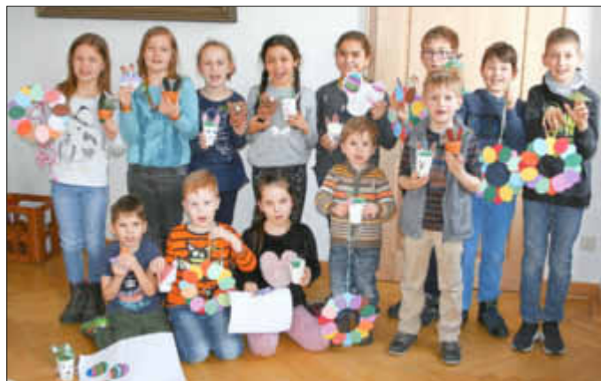
Die noch anwesenden Bastelkinder präsentieren dem Fotografen stolz ihr Gebasteltes.