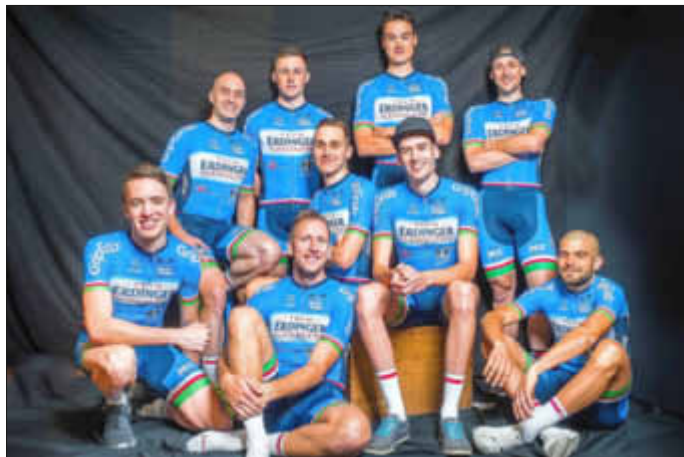
Unser Team wieder zu Hause

auf das Straßentraining konzentriert. Ein Freizeit – Angebot ist in Planung und soll unseren Schülern ein wenig Abwechslung beschieren. Noch soll der Sport Freude bereiten und Freundschaften knüpfen. Viel zu schnell wird aus dem Spiel dann Ernst und harter Wettkampf-Sport. Im internationalen Radsport waren in der letzten Woche die Bahn-Weltmeisterschaften angesagt. In Apeldoorn, Belgien, waren unsere deutschen Sportler wieder einmal recht erfolgreich. In Südfrankreich läuft, ganz aktuell, eines der ersten Etappen-Rennen „Paris-Nizza“ und wir Radsportfreunde kommen schon wieder in den Genuss schöner Fernseh-Bilder. So steigert sich, ganz langsam, die Vorfreude auf die südpfälzische Straßensaison, der wir mit großer Aufmerksamkeit entgegen sehen.