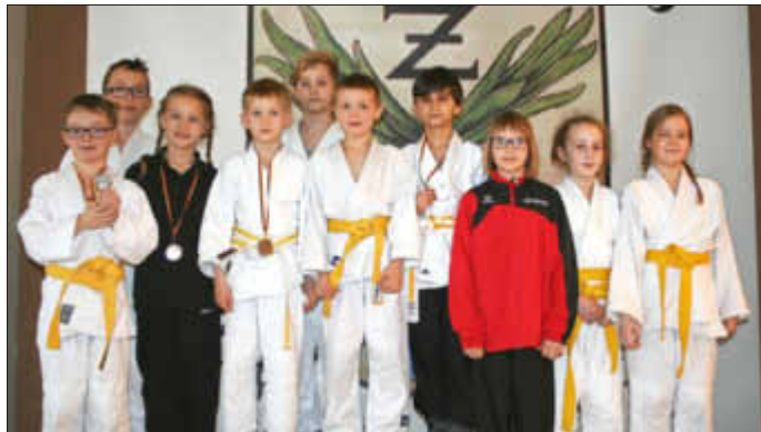
Ein Teil der Zeiskamer Judokas der Altersklasse U10 und U12, die am Samstag und Sonntag um Medaillen kämpften.

Für viele waren es die ersten Kämpfe. Nachdem alle Medaillen und Pokale verteilt waren, verabschiedete der 1. Vorsitzende die Gäste und bedankte sich beim Rotkreuz und allen Helfern und Kuchen spendern. Auch auf diesem Weg nochmals recht herzlichen Dank für die Unterstützung bei allen, die diese Veranstaltung unterstützt haben. Insbesondere bei den Sponsoren der Sparkasse Germersheim-Kandel, VR-Bank Südpfalz, Thüga Netz, Thüga Energie, Bleistift Bellheim, Fa. Wolfware, Rudis Vehikelshop, Maler Seiler, Fa. Nolte Holzwerkstoff, Löwen-Apotheke Bellheim und Gesund und Vital Bellheim.