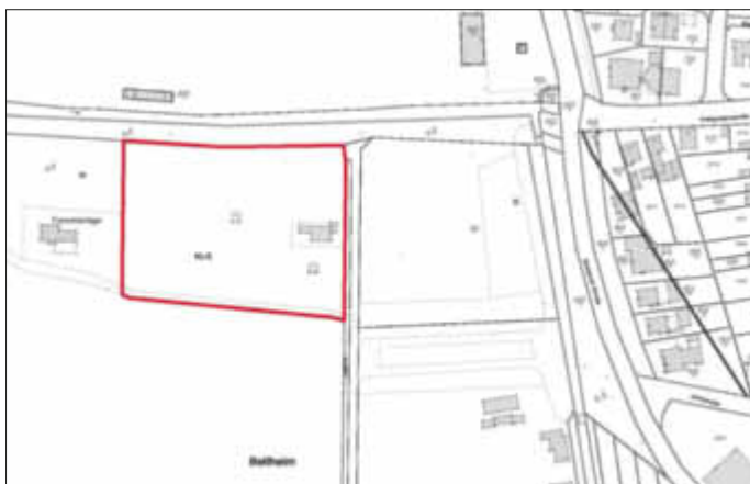
Geltungsbereich des Bebauungsplans „In der Auchtweide“ einschließlich der 1. vereinfachten Änderung.

gemäß § 214 Abs. 4 BauGB rückwirkend in Kraft.