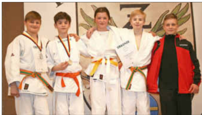
Die Kämpfer der U15 präsentierten ihre Trophäen.