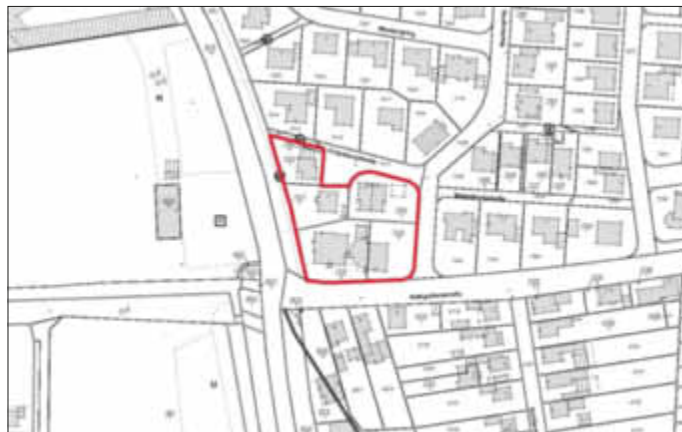
Geltungsbereich des Bebauungsplans „Lächer“ einschließlich der 3. + 4. vereinfachten Änderungen