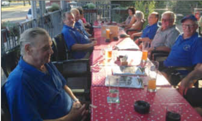
Teilnehmer beim gemütlichen Beisammensein in der „Fellach“