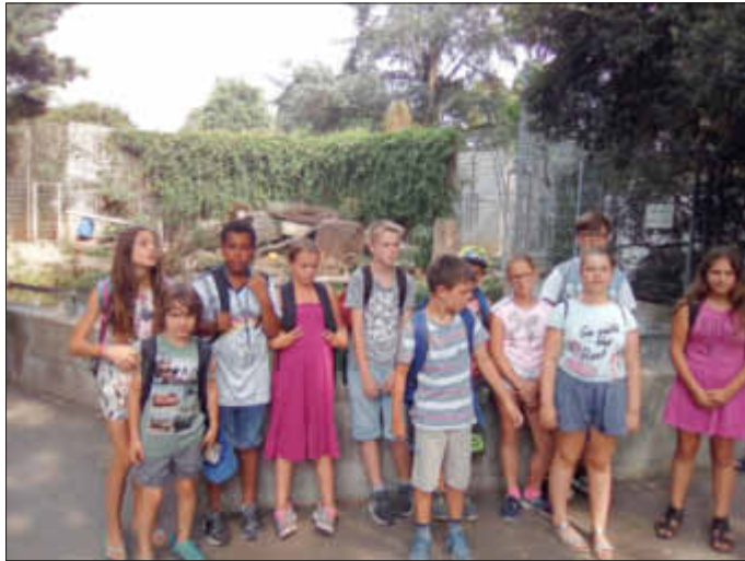
Im Heidelberger Zoo

Am Montag und Dienstag wurden die Freibäder in Wörth und Bellheim besucht und auf ihren Spaßfaktor getestet. Ergebnis: Sehr gut. Am Mittwoch ging es in den Zoo nach Heidelberg, wo viele verschiedene Tiere zu sehen waren. Am Donnerstag wurde es sportlich. Alle radelten nach Rülzheim zum ALLA Hopp-Spielplatz und verbrachten dort einen schönen Tag. Am Freitag wurde es exotisch. Es stand eine Lama-Wanderung durch den Pfälzer Wald auf dem Programm. Mit Sicherheit eines der Highlights der Woche. Allen Kindern und dem Jugendpflegeteam hat diese Woche sehr viel Spaß gemacht.