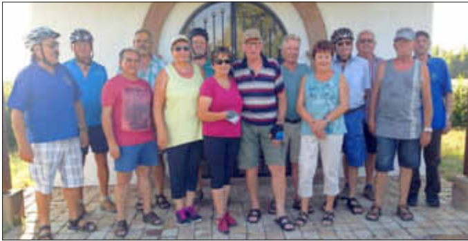
Die Radler vor der Kapelle in Knittelsheim