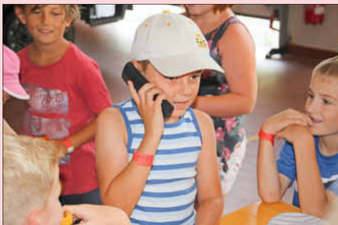
Ein Notruf wird abgesetzt

Spaß und Fun – beim 15. Feriennachmittag der Freiwilligen Feuerwehr Bellheim am 03.08.2018