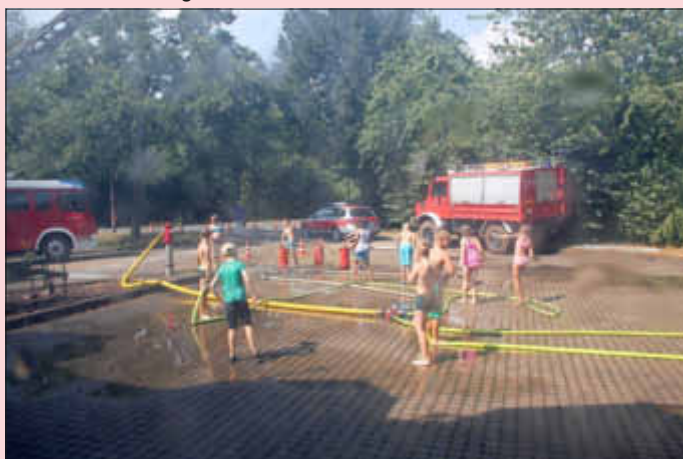
Üben mit dem Schlauch