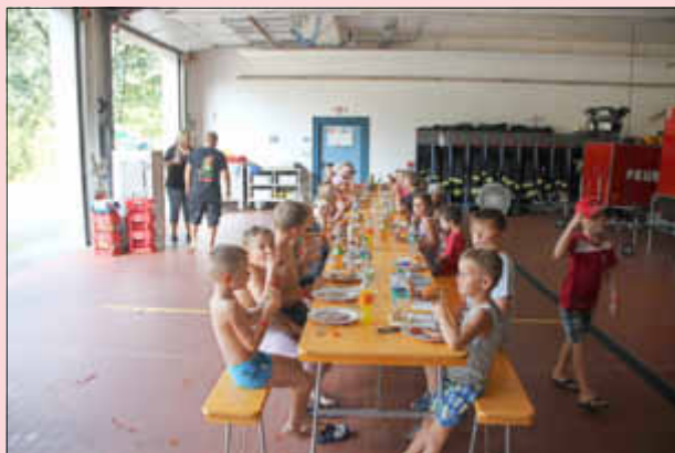
Stärkung für alle