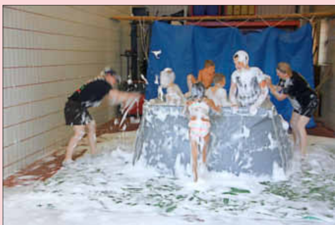
Spaß im Schaumbecken