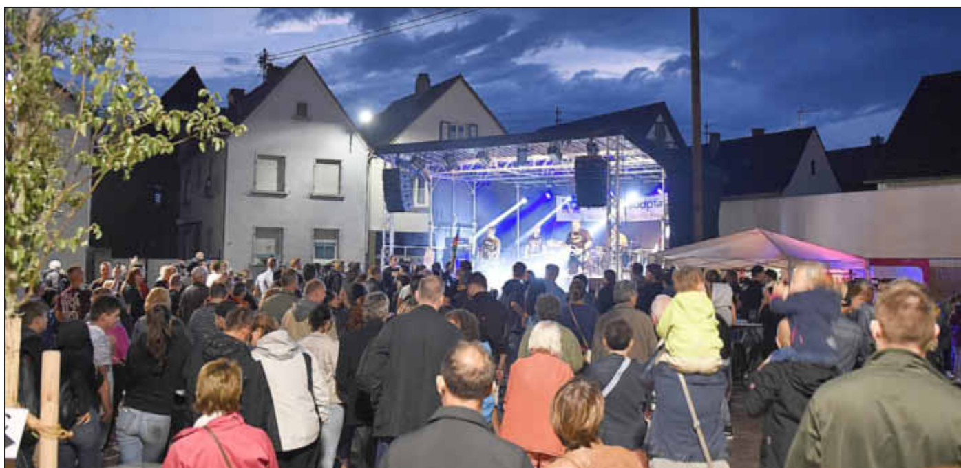
... wo man geht und steht