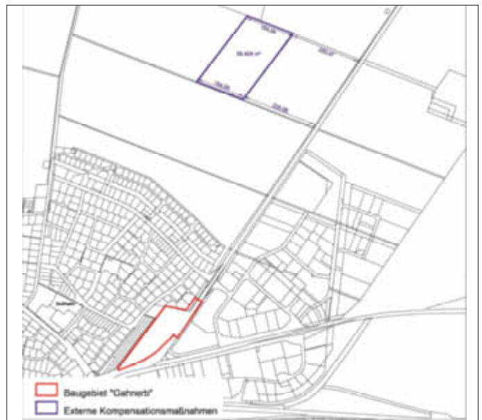
Lageplan und Geltungsbereich des Bebauungsplans