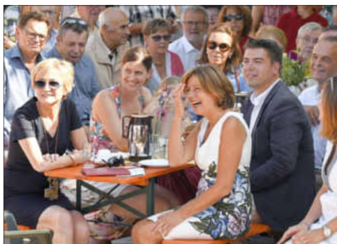
Man unterhält sich bestens