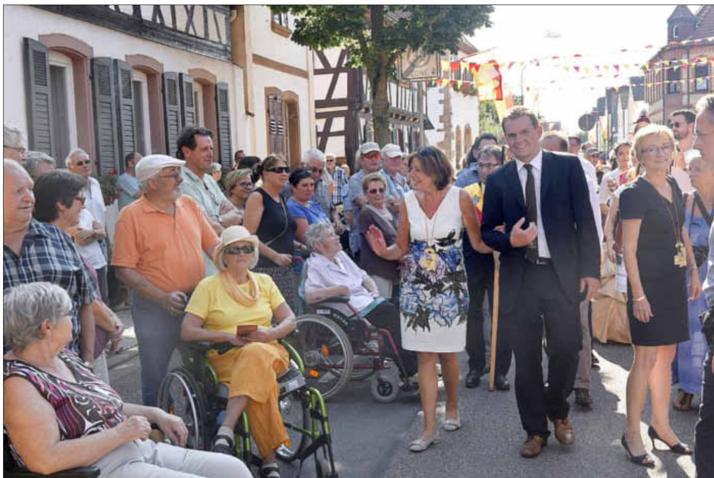
„Bad in der Menge“