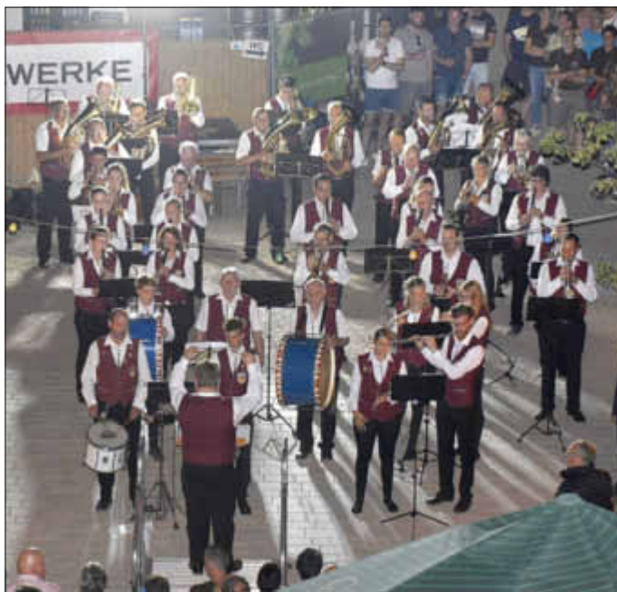
Die Musikkapelle in Aktion