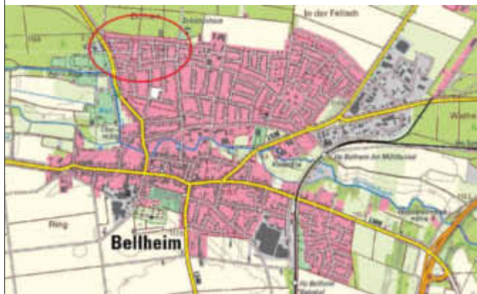
Lage des Plangebietes