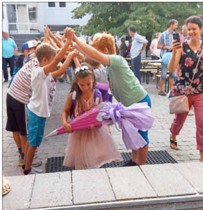
Auf geht's ins Abenteuer „Schule“!