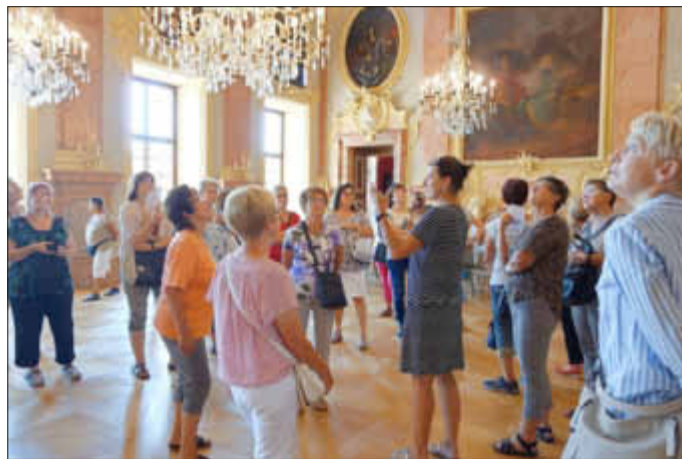
Schlossführung im Residenzschloss Rastatt

Bei unserem Jahresausflug, der letzte Woche stattfand, führte uns die Reise ins Residenzschloss nach Rastatt.