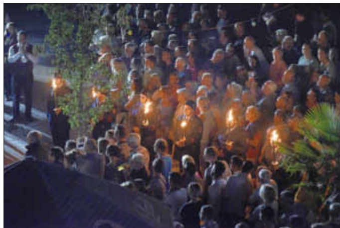
Der Große Zapfenstreich

Das große Festwochenende im Jubiläumsjahr verlief friedlich und es kam zu keinen nennenswerten Vorkommnissen, so Ortsbürgermeister Job. Zu Ende ging es Sonntagabend mit einem großen Zapfenstreich, den sich abermals rund 2000 Besucher nicht entgehen ließen. Tausende von Besuchern kamen über das lange Festwochenende nach Ottersheim. Viele aus dem Umkreis, aber auch aus dem badi-schen Raum, aus der Vorderpfalz oder kamen sogar mit dem Reisebus aus weiteren Regionen angereist, selbst aus den USA reisten mehrere Familien an.