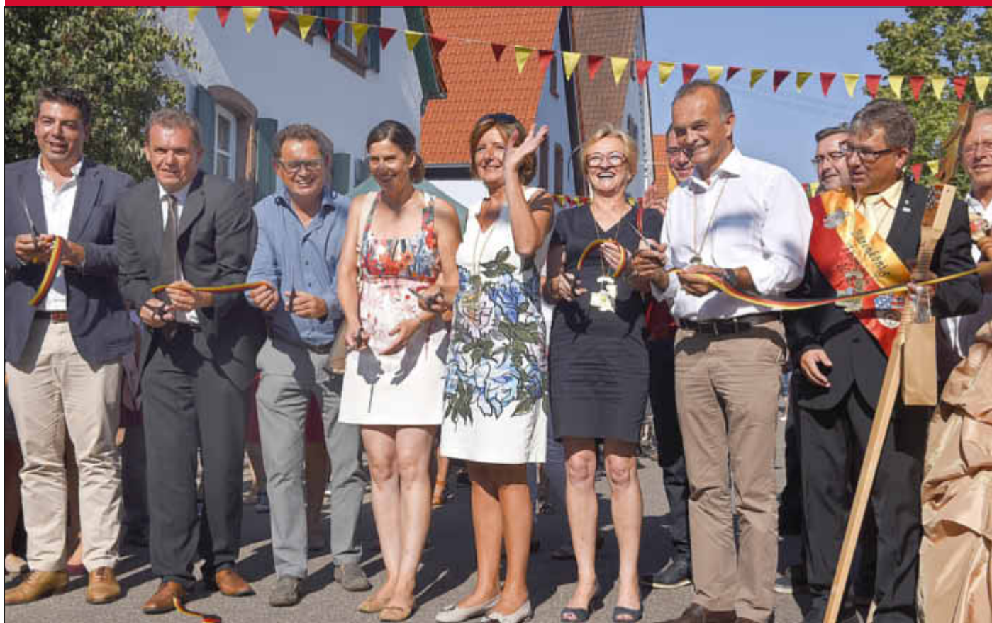
Ministerpräsidentin Malu Dreyer eröffnet den Bauernmarkt

Gefeiert wurde von Freitag bis Sonntag und das nicht einfach nur so: Fast das gesamte Dorf verwandelte sich in eine Festmeile, an der es an jeder Ecke etwas zu entdecken gab. Das 1250-jährige Bestehen der zweitältesten Gemeinde des Landkreises sollte schließlich gebührend gefeiert werden.