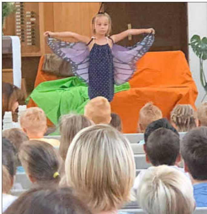
Die kleine Raupe hat ihr Geheimnis gelüftet!