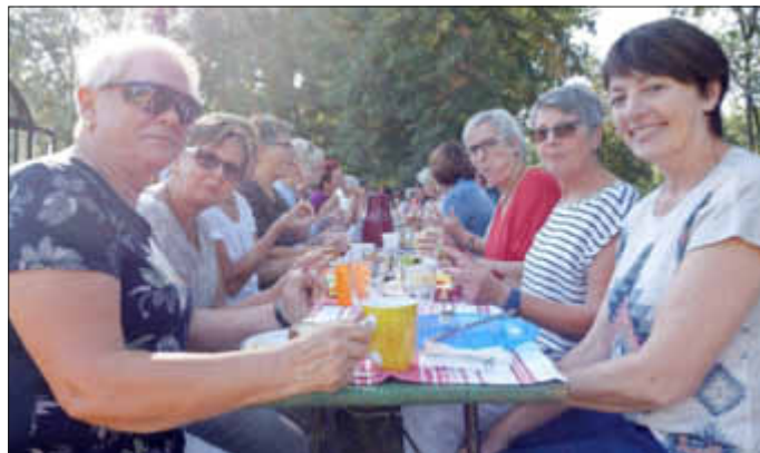
Wie man sieht, schmeckt's allen bei der Frühstückstafel!

Nach einer Schlossführung, benötigten wir in Rastatt dann doch geraume Zeit um uns bei dem heißen Wetter wieder zu erfrischen. Das