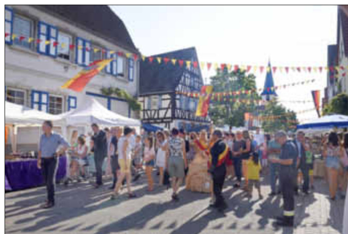
Auf der Festmeile

Gefeiert wurde von Freitag bis Sonntag und das nicht einfach nur so: Fast das gesamte Dorf verwandelte sich in eine Festmeile, an der es an jeder Ecke etwas zu entdecken gab. Das 1250-jährige Bestehen der zweitältesten Gemeinde des Landkreises sollte schließlich gebührend gefeiert werden.