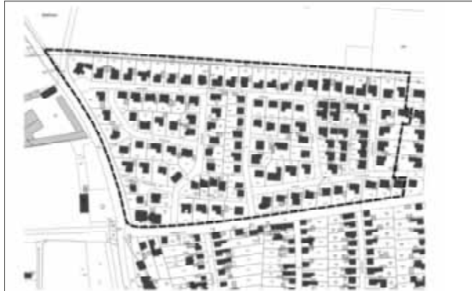
Geltungsbereich des Bebauungsplans o.M.

Eine beachtliche Verletzung der in § 214 Abs. 1 Satz 1 Nr. 1 bis 3 BauGB bezeichneten Verfahrens- und Formvorschriften, eine unter Berücksichtigung des § 214 Abs. 2 BauGB beachtliche Verletzung der Vorschriften über das Verhältnis des Bebauungsplanes und des Flächennutzungsplanes sowie nach § 214 Abs. 3 Satz 2 BauGB beachtliche Mängel des Abwägungsvorgangs sind unbeachtlich, wenn sie nicht innerhalb eines Jahres seit dieser Bekanntmachung schriftlich gegenüber der Gemeinde unter Darlegung des die Verletzung begründenden Sachverhalts geltend gemacht worden sind.