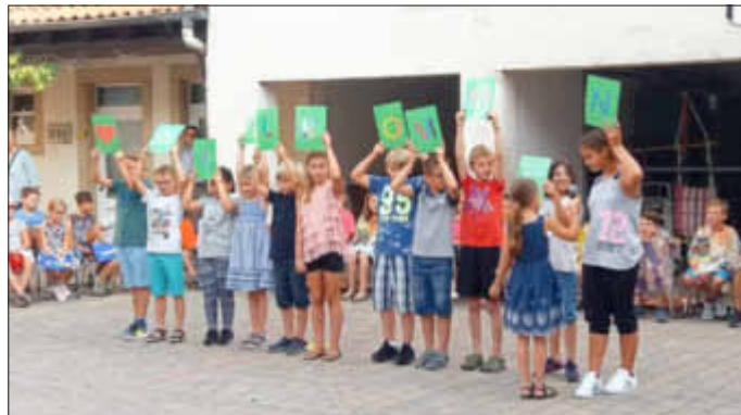
Willkommensgrüße der 4a

Die Fuchsbach Grundschule Zeiskam wünscht allen einen guten Start ins neue Schuljahr!