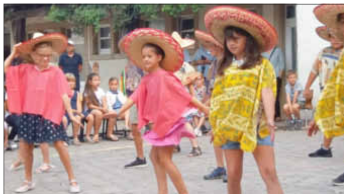
Mexikanerinnen der 4b