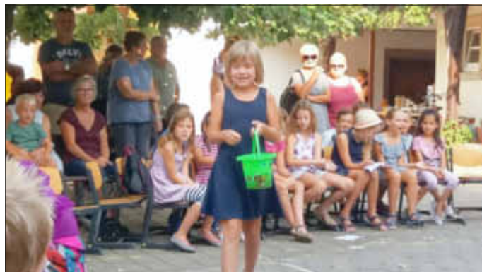
„Water is a fun“ – Gegen eine kleine Abkühlung hatte keiner etwas einzuwenden.