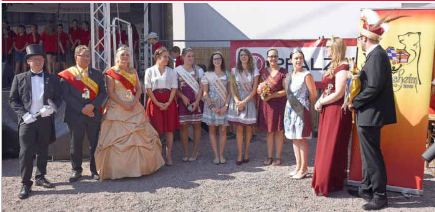
Es grüßen die Hoheiten des Landkreises