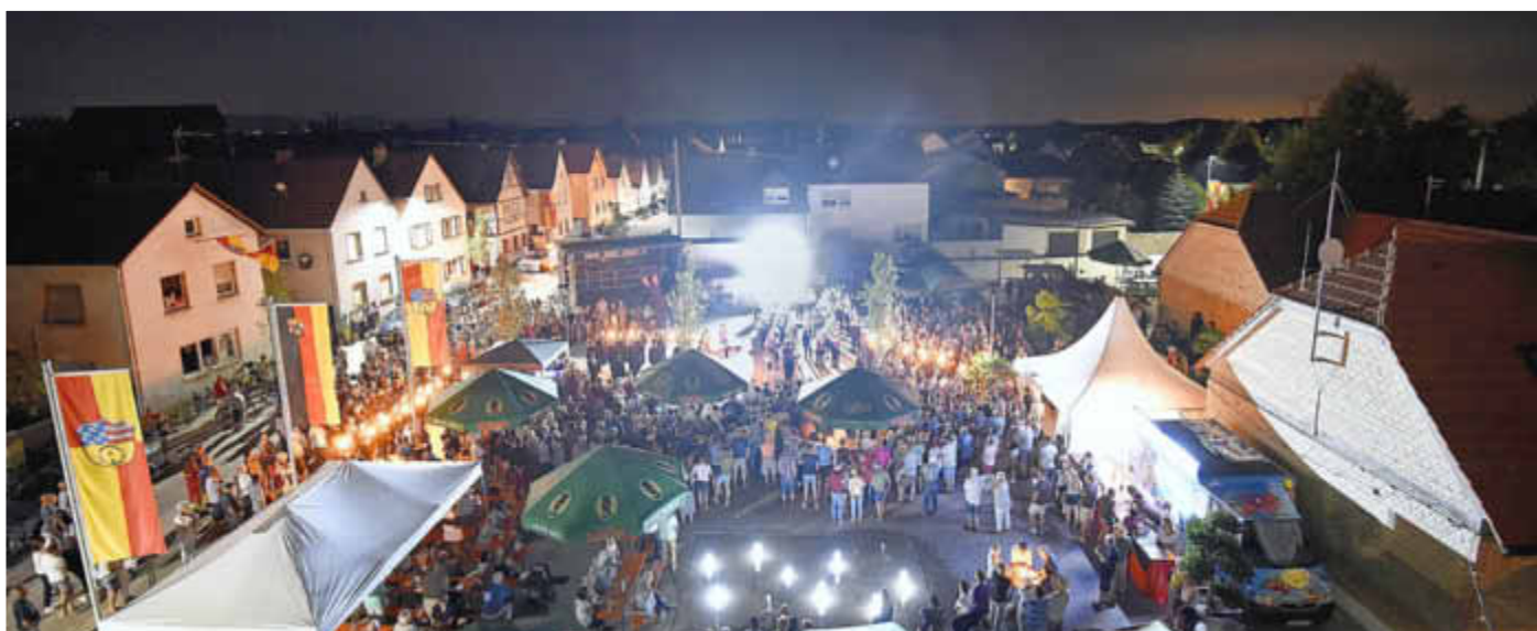
Der neu gestaltete Dorfplatz erstrahlt im Lichterglanz