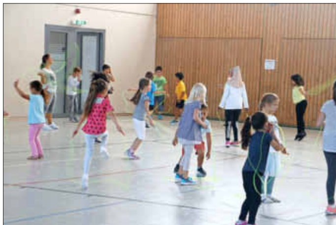
Der Funke ist übergesprungen - die ganze Halle springt Seil.