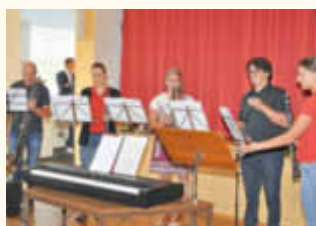
Musikalische Unterhaltung mit dem Schwarzwurzel-Ensemble