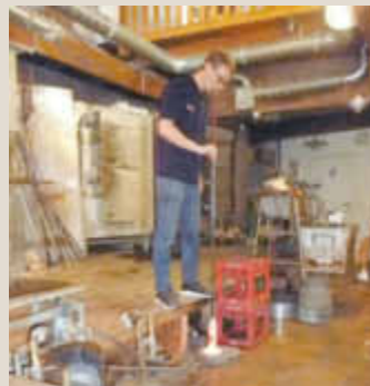
Der Glasbläser bei der Arbeit