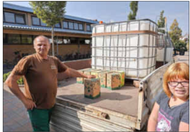
Endspurt: Die letzten der 31 Saftboxen werden vom Bellheimer Bauhof abgeladen