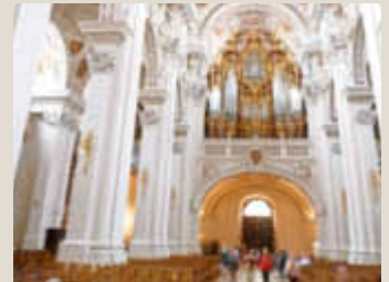
Passauer Dom mit der Orgel