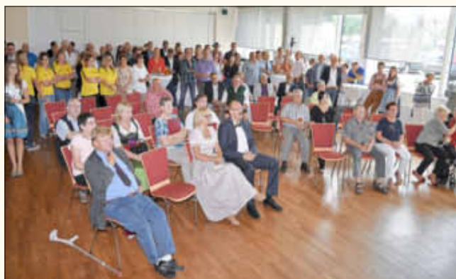
Zahlreiche Gäste waren zum Empfang gekommen