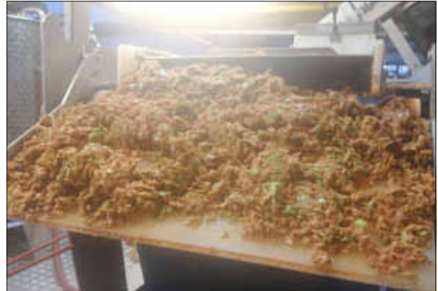
Was von den Äpfeln und Birnen übrig blieb: Leckeres Futter für Ziege und Rinder in der Region!

Diese ersten Liter Bellheimer Streuobstsfts werden nicht die letzten bleiben. Die Grundschule will zukünftig alljährlich diesen „Bellheimer Streuobsttag“ wiederholen. An dieser Stelle ein Dankeschön an die Gemeinde für das Stemma der Kosten für die Saftpressung und an den Bellheimer Bauhof für die tatkräftige Unterstützung, v.a. beim Abtransport der Äpfel und der Anlieferung des Saftes!