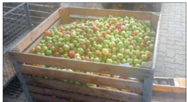
220 kg Äpfel und Birnen warten in der Kelterei auf ihre Verpressung