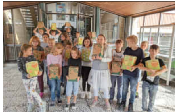
Da sind sie! Unsere Erntehelfer mit den ersten Bellheimer Streuobst-Saftboxen.