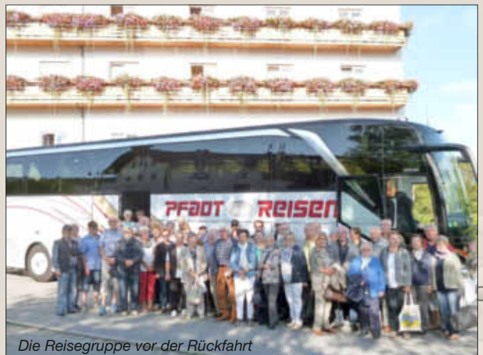
Die Reisegruppe vor der Rückfahrt