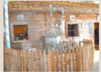
Die gläserne Destille im Schnapsmuseum