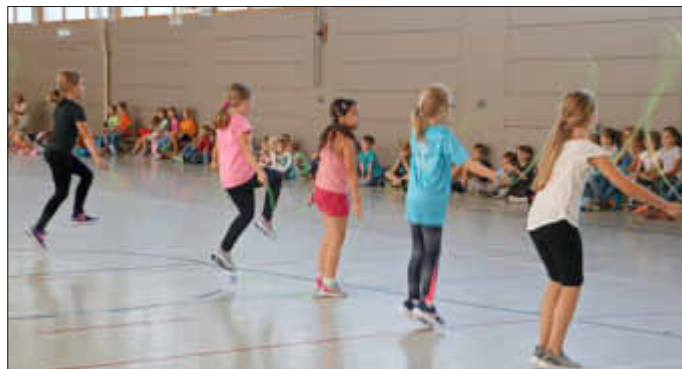
Die Aufführung vor vielen Zuschauern.