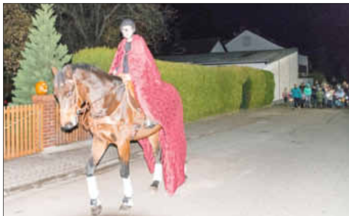
St. Martin hoch zu Ross