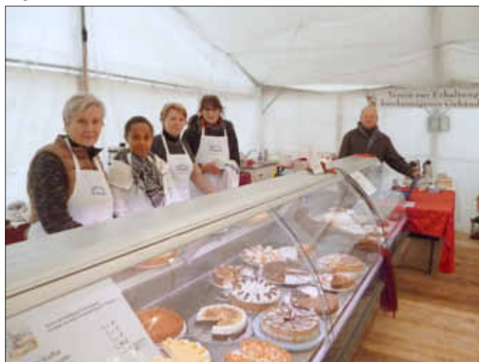
Archivbild vom letzten Jahr

Auch in diesem Jahr wird der Verein zur Förderung und Erhaltung kircheneigener Gebäude der Kirchenstiftung St. Nikolaus Bellheim, die Cafeteria beim Nikolausmarkt, der vom 7. bis 9. Dezember 2018, stattfindet, betreiben. Hierzu wird eine Vielzahl von Kuchen benötigt. Der Verein bittet deshalb um eine Kuchenspende, deren Erlös für die Innenrenovierung der Pfarrkirche St. Nikolaus bestimmt ist. Wer einen Kuchen spenden möchte, wird gebeten, sich beim 2. Vorsitzenden Wolfgang Kaiser, Tel.: 07272 / 2137, zu melden oder sich in die Spenderliste, die in der Bäckerei Kaiser ausliegt, einzutragen. Schon jetzt sagen wir allen Kuchenbäckerinnen ein herzliches Dankeschön.