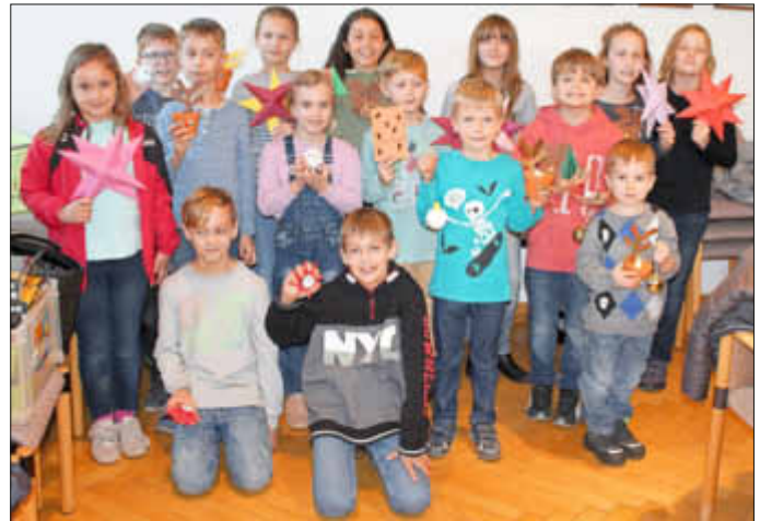
Stolz präsentierte ein großer Teil der Bastler seine Kunstwerke, bevor sie den Heimweg antraten.