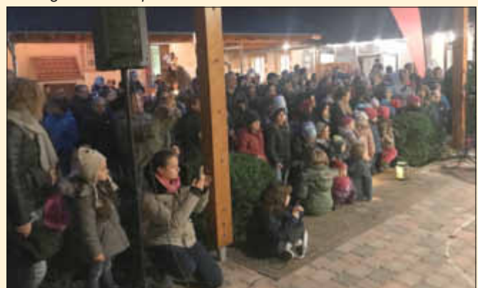
Zuschauer beim Lichtertanz