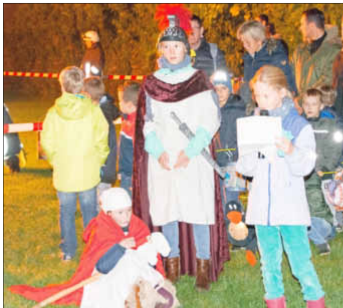
Aufführung des Martinsspiels