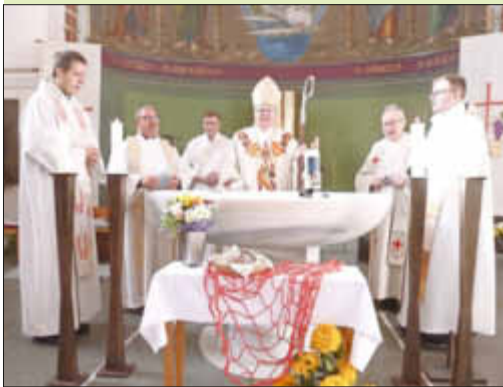
Weihbischof Otto Georgens mit den Mitzelebranten am Altar