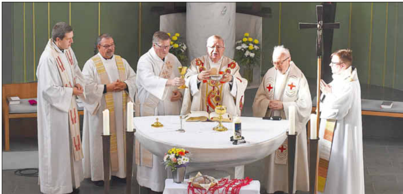
Weihbischof Georgens und die Mitzelebranten bei der Eucharistiefeier