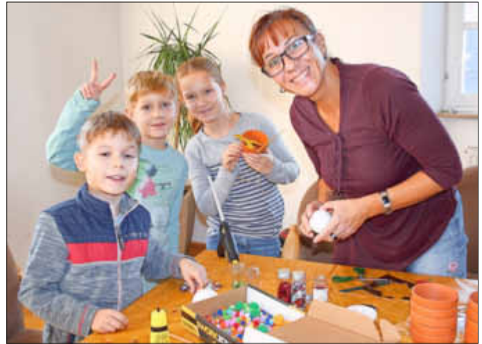
Nicht nur die Budo-Kids hatten wieder Spaß.

Vielen Dank den Muttis, die die Kinder betreuten und für die tollen Ideen, sowie der Gemeinde für die Überlassung des Ratsaals.