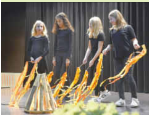
Tanz um das Martinsfeuer