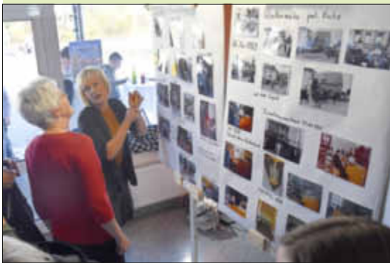
Die Fotoausstellung fand viel Interesse