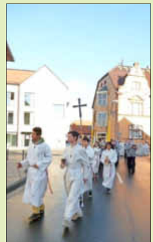
Einzug in die Kirche