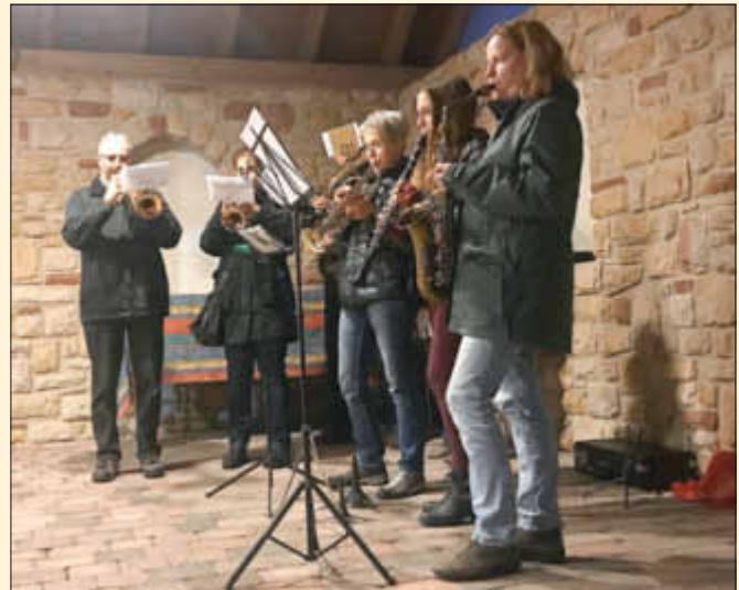
Die Jugendmusikkapelle bereichert die Feierstunde