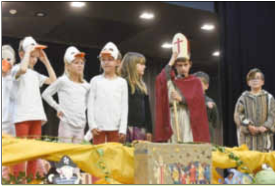
Grundschüler erzählen die Martinsgeschichte