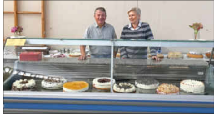
Das gut bestückte Kuchenbuffet

verein konnte im Jahre 2018 die stolze Summe von 35.000,00 € der Kirchengemeinde übergeben, so dass die zwischenzeitlich schon begonnene Sanierung des Kirchturms einschließlich Glockenstuhl durchgeführt werden kann.