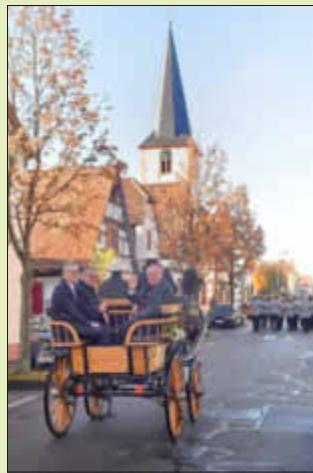
Kutschfahrt zur Kirche