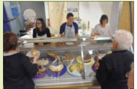
Die Kuchentheke war gut bestückt