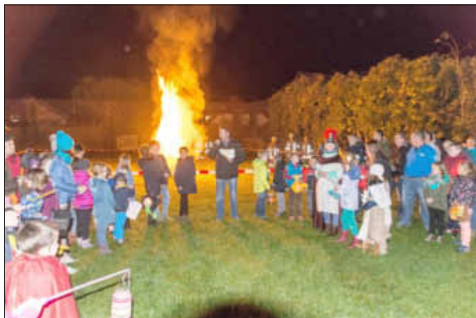
Das Martinsfeuer brennt