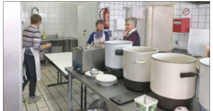
Köchinnen und Töpfe stehen bereit

Ein großer Sanierungsbrocken liegt noch vor uns. Der Kirchbauverein ist zusammen mit der Kirchengemeinde von einem guten Gelingen überzeugt. Jeder ist herzlich willkommen, Spenden natürlich auch: SPK Germersheim-Kandel: IBAN: DE 93 5485 1440 1000 4957 37 / BIC: MALADE51KAD und VR-Bank Südpfalz: IBAN: DE69 5486 2500 0000 6292 86 / BICGENODE61SUW. Vielen Dank.