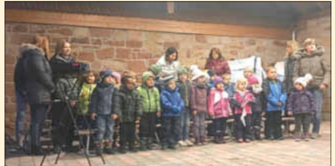
Die Kita-Kinder beim Liedvortrag