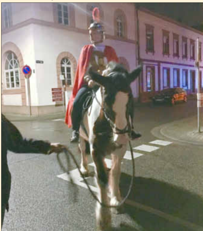
St. Martin hoch zu Ross