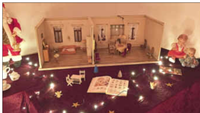
Puppenstube um 1900