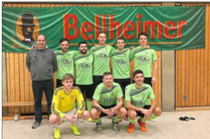
Das Foto zeigt das erfolgreiche Team des FSV Offenbach.