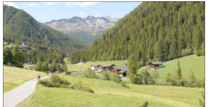
Ultental - Südtirol

Im ersten Beitrag vermitteln sie Eindrücke von der französischen Weinstraße Côte d'Or mit ihren berühmten Städten Dijon und Beaune in Ost-Burgund.