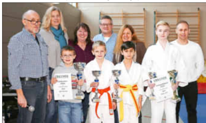
Die Jubilare und die erfolgreichen Judokas mit ihren Trophäen.

Hier wurden spektakuläre Fallübungen und Würfe gezeigt. Hier erkannte man bei einigen, dass ein weiterer Schritt in Richtung Meistergrad, erreicht wurde. Dies lässt für die Zukunft hoffen. Nach dem ausgiebigen Springen auf der Hüpfburg und dem Verteilen von Blumen und Tieren, die der Zauberer aus Luftballons zauberte, bekam jeder Aktive noch ein Präsent überreicht. Der erste Vorsitzende bedankte sich bei allen Akteuren und den Mitgliedern für ihr Kommen und wünschte einen guten Nachhauseweg. Ein besonderer Dank gilt den Helfern, den Kuchenbäckern und den Sponsoren (Sparkasse Ger-Kandel, VR Bank Südpfalz und Thüga Energie).