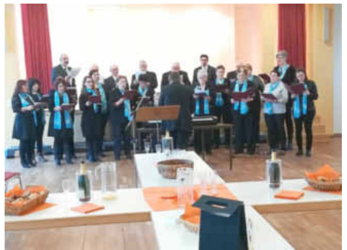
Der Kath. Kirchenchor