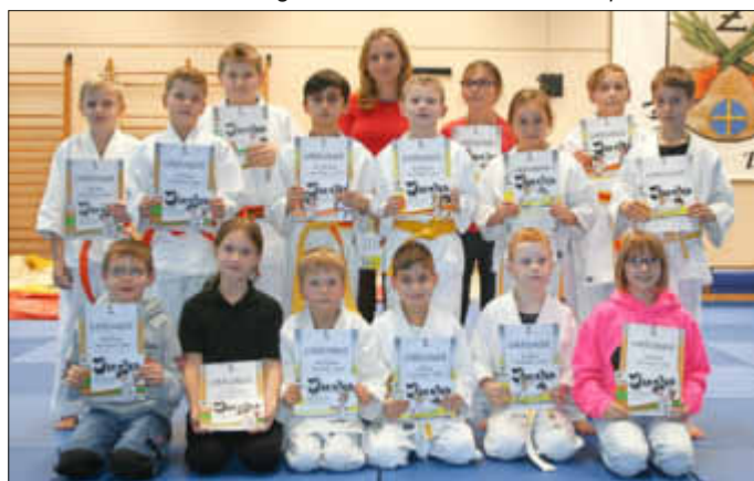
Stolz präsentieren die Prüflinge nach der Ehrung ihre Urkunden.