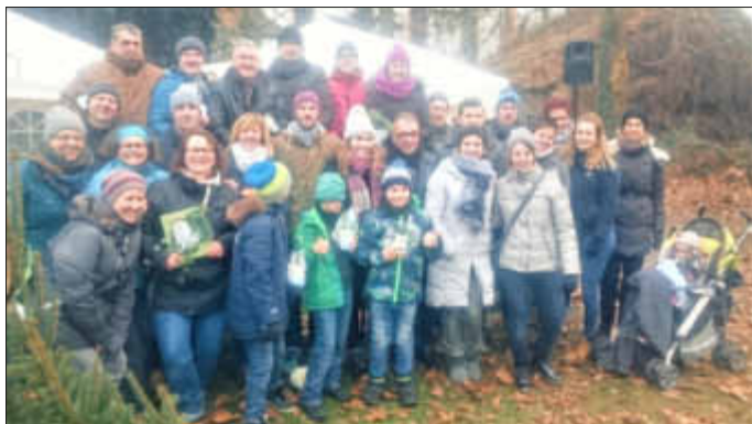
Die Teilnehmer am zweiten Knutfest in Zeiskam nach der Absolvierung der Wettbewerbe.

Wie im vergangenen Jahr bestand eine Mannschaft aus drei Teilnehmern bzw. Teilnehmerinnen, die die Disziplinen Tannenweitwurf, Tannenhochwurf und Tannenschleudern absolvierten. Dabei stand die im Pfarrgarten stattfindende Veranstaltung im Zeichen des Spaßes.