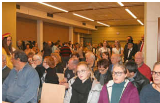
Zahlreiche Bürgerinnen und Bürger waren zum Neujahrsempfang gekommen