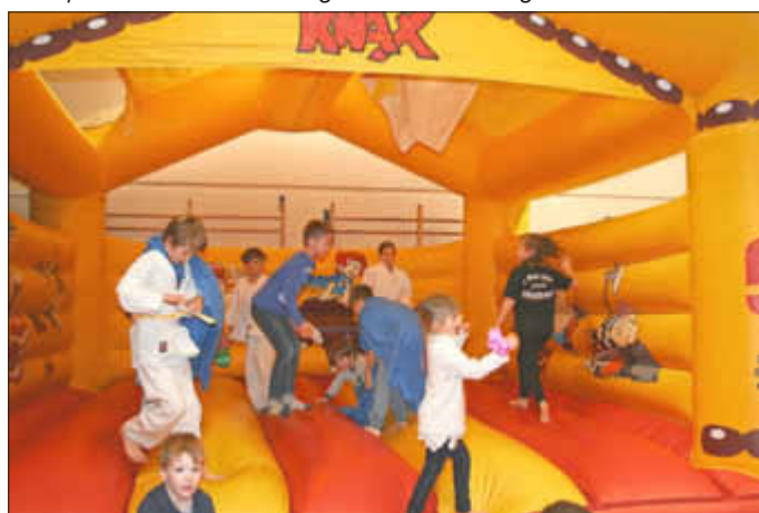
Die Hüpfburg war ein begehrtter Aufenthaltsort in den Pausen.