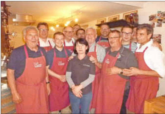
Archivbild vom letzten Kochkurs für Männer