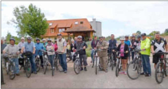
Archivbild: Die Radpilger vor der Rückfahrt