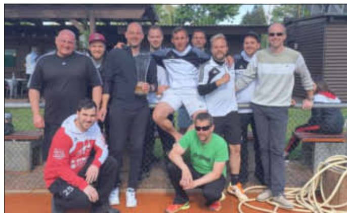
Die Herren 30 nach ihrem Coup gegen den TC Neuburg

Herren 65 (4er A-Klasse): TC Zeiskam - TC Kusel 1