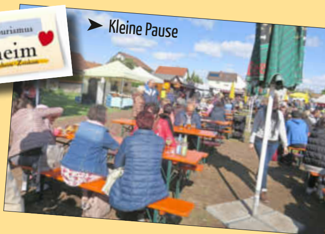
➤ Kleine Pause