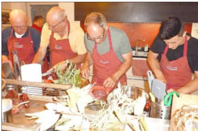
Die Männer bei der Zubereitung der Speisen