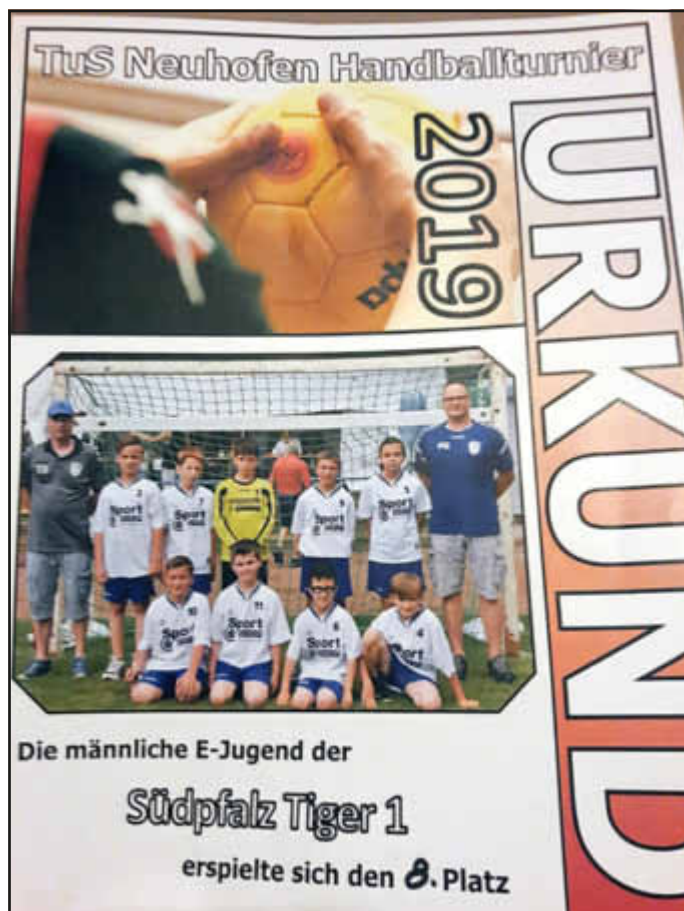
Die männliche E-Jugend der Südpfalz Tiger 1 erspielte sich den 8. Platz