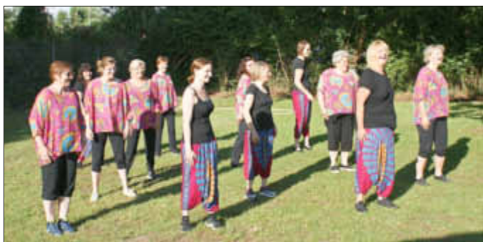
Jazz-Gymnastik zeigt ihr Können