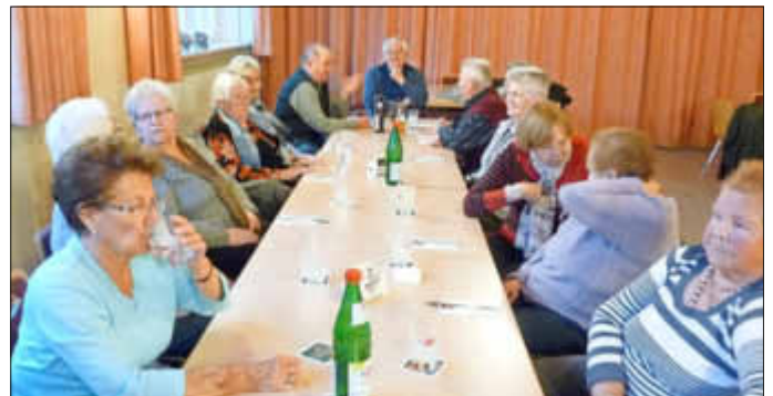
Archivbild: Ein Teil der Senioren beim Seniorenstammtisch

Wir weisen noch einmal darauf hin, dass der nächste monatliche Seniorenstammtisch des Katholischen Arbeitervereins wegen der Wallfahrt nach Walldürn erst am Donnerstag, 11. Juli 2019, um 14.00 Uhr, im Pfarr- und Jugendheim St. Michael stattfindet.