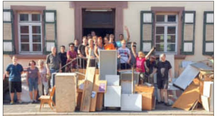
Die fleißigen Helferinnen und Helfer nach der Räumaktion

Mit dabei waren auch zehn Schüler des Eduard-Spranger-Gymnasiums Landau sowie des Goethe-Gymnasiums Germersheim, die sich durch die Aktion ihre Abi-Kasse auffüllen wollten. Dabei haben wir sie gerne unterstützt.