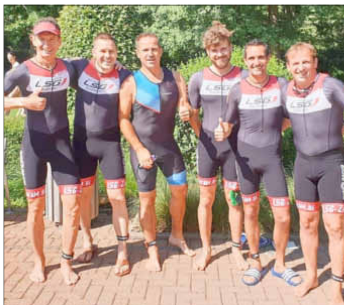
Die Triathleten der LSG vor dem Start in Herxheim.