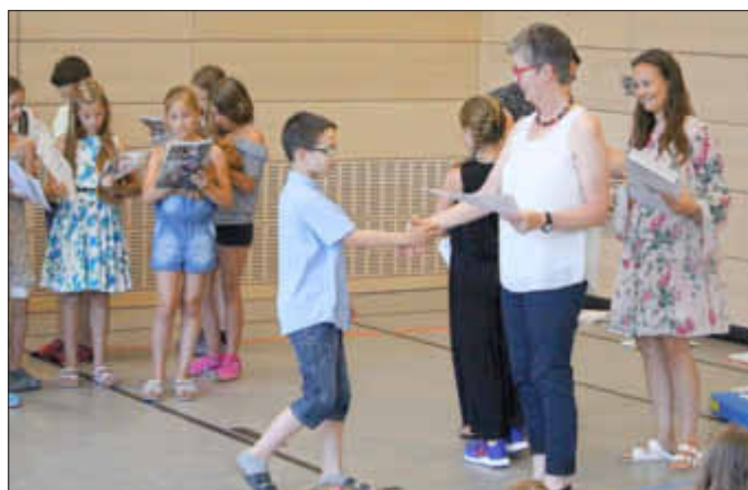
Die Viertklässler erhalten ihre Abschlusszeugnisse und Abschiedsgeschenke