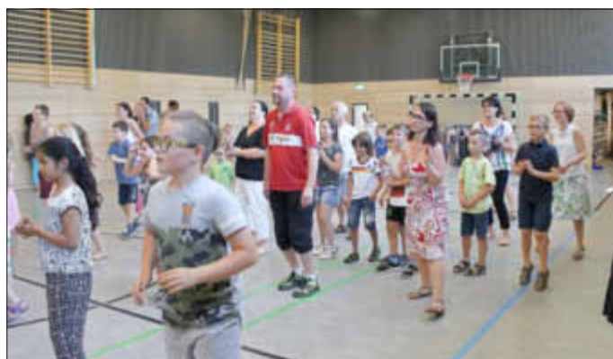
und alle tanzen mit...