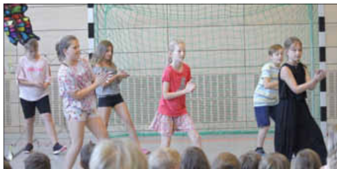
Tanzvorführung der Viertklässler