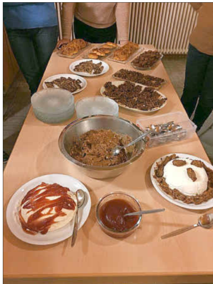
Ein Auszug der vielen Köstlichkeiten

Obwohl alle schon pumperl satt waren musste natürlich das Dessert eine Joghurt Sahnekuppel mit einer Dulce de leche mit Salznüssen oder leckerem Hagebuttengelee mit Äpfel und Rotwein probiert werden. Alle Rezepte waren gelungen und schmeckten super lecker. Vielen Dank an Anette und Wolfgang für's Walnuss knacken vorweg und Silvia für die liebevollen Aufmerksamkeiten.