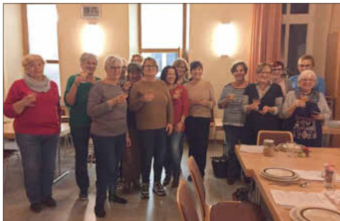
Alle strahlen - Geschafft! Jetzt geht's ans Essen.

Alle Beteiligten waren des Lobes voll und meldeten sich gleich für das nächste Mal an, bevor sie glücklich und zufrieden den Heimweg antraten.