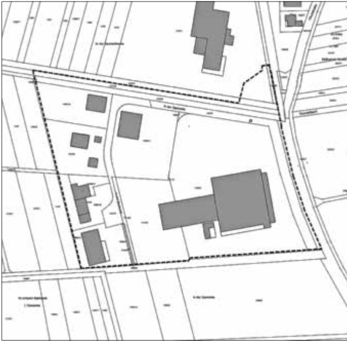
Geltungsbereich des Bebauungsplans „Gewerbegebiet In der Sauheide“ der Ortsgemeinde Zeiskam