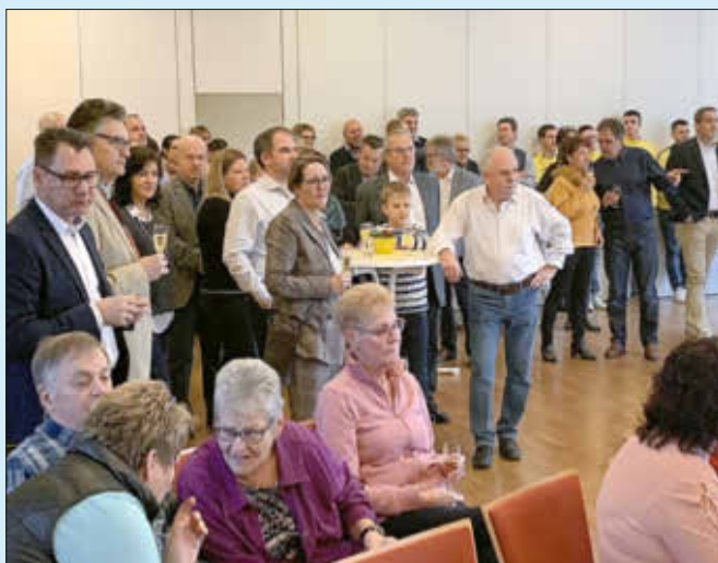
Gäste beim Neujahrsempfang