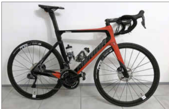
Teamrad Saison 2020