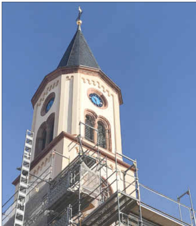
Sanierter Kirchturm mit neuer Kirchturmuhre