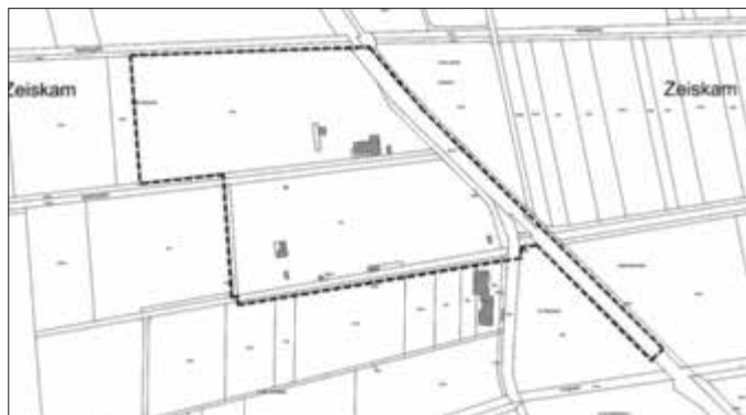
Geltungsbereich des Bebauungsplans „Sportzentrum“ der Ortsgemeinde Zeiskam

Mit der erneuten Bekanntmachung gemäß § 10 BauGB tritt der Bebauungsplan „Sportzentrum“ gemäß § 214 Abs. 4 BauGB rückwirkend zum 03.07.1986 in Kraft.