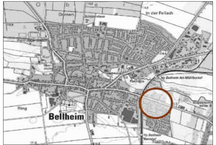
Lage des Plangebiets

Nach Ablauf dieser Frist gilt die Satzung als von Anfang an gültig zustande gekommen; dies gilt nicht, wenn die Vorschriften über die Öffentlichkeit der Sitzung, die Genehmigung oder Bekanntmachung der Satzung verletzt worden sind. Abweichend hiervon kann die Verletzung der Verfahrens- oder Formvorschriften auch nach Ablauf der Jahresfrist von jedermann geltend gemacht werden, wenn der Bürgermeister dem Satzungsbeschluss nach § 43 GemO wegen Gesetzeswidrigkeit widersprochen hat, oder wenn vor Ablauf der Jahresfrist die Rechtsaufsichtsbehörde den Satzungsbeschluss beanstandet hat oder ein anderer die Verletzung von Verfahrens- oder Formvorschriften innerhalb der Jahresfrist geltend gemacht hat. Auf die Vorschriften des § 44 Abs. 3 Satz 1 und 2 BauGB über die Geltendmachung etwaiger Entschädigungsansprüche nach den §§ 39 bis 43 BauGB und die Vorschriften des § 44 Abs. 4 BauGB über das Erlöschen der Entschädigungsansprüche bei nicht fristgemäßer Geltendmachung wird hingewiesen.