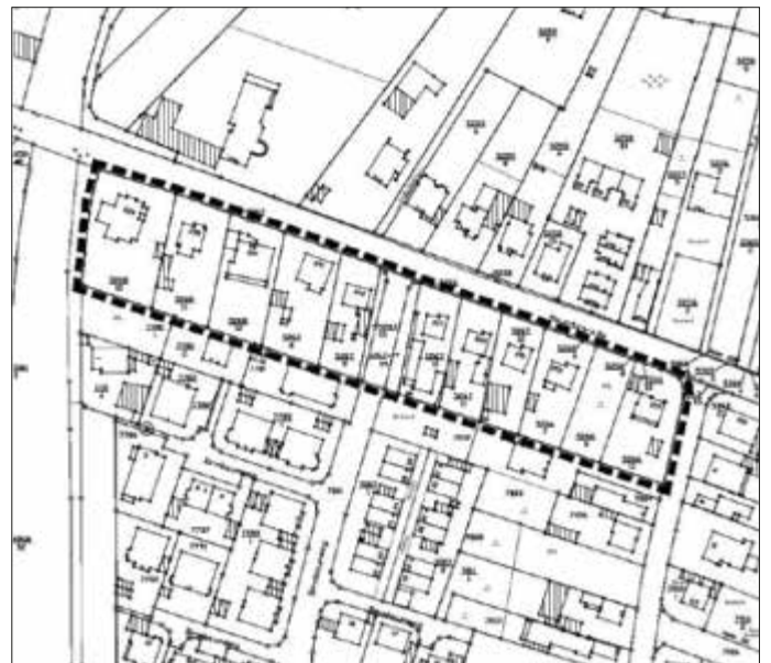
Geltungsbereich des Bebauungsplans (nicht maßstäblich)