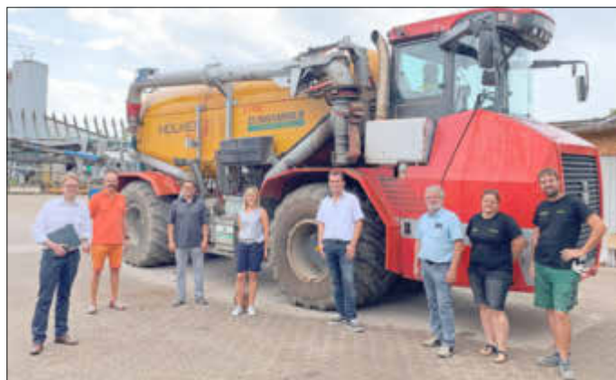
Sommertour Dr. Gebhart

Im Gespräch mit den Bürgermeistern in der Verbandsgemeinde informierte sich Gebhart über aktuelle Herausforderungen. Die Bürgermeister der Verbandsgemeinde, aus Bellheim, Knittelsheim, Ottersheim und die Bürgermeisterin aus Zeiskam informierten über Entwicklungen vor Ort, etwa die durchweg hohe Nachfrage nach Baugelände oder die Anbindung der Gemeinden an die Stadtbahnlinie in Bellheim. Thomas Gebhart: „Mir ist es wichtig, durch die Gespräche vor Ort immer wieder zu hören, welche Anliegen es in den Gemeinden gibt.“