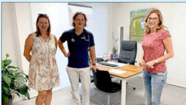
Praxis am Eck, Ministerin Bätzing-Lichtenthäler