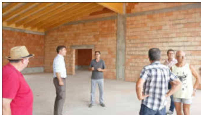
Im Neubau des Feuerwehrhauses