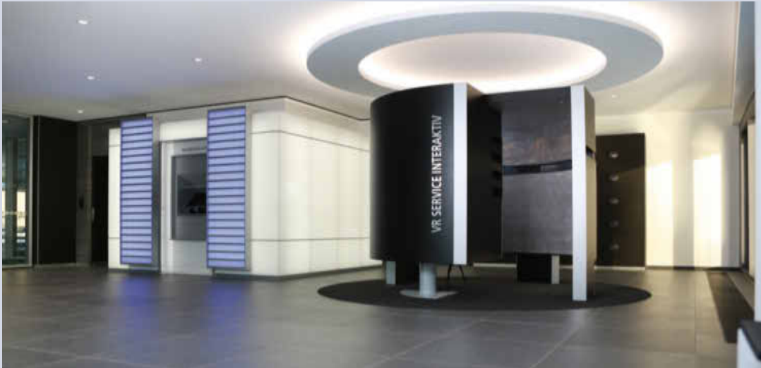
SISy-Kabine in Ottersheim

Die Verbandsgemeindeverwaltung steht seit 29.01.2020 über das VR-Service-Interaktiv-System, kurz VR-SISy für Beratung der bürgerlichen Anliegen zur Verfügung.