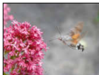
Ein Schmetterling - kein Kolibri!