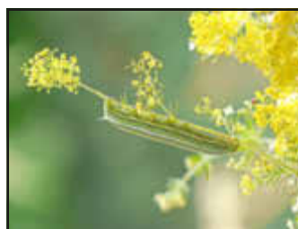
Raupe des Taubenschwänzchen an Labkraut

Neuerdings überwintern Taubenschwänzchen auch in einigen milden Regionen Süddeutschlands, so dass man einzelnen Exemplaren in jedem Monat des Jahres begegnen kann. So gab es im März Beobachtungen von Überwinterern in Knittelsheim und Zeiskam. Diese frühen Falter legen ihre Eier an Labkräutern ab, von denen sich später die Raupen ernähren. Gegen Mitte Juni schlüpft dann die erste neue Faltergeneration des Jahres.