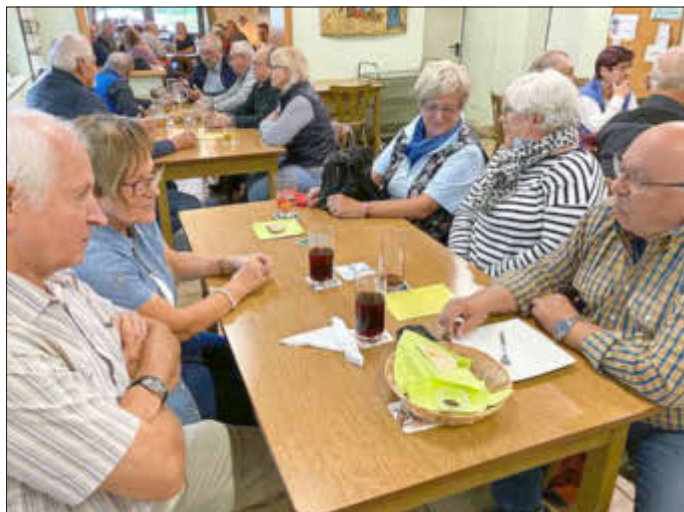
Kurz vorn Aufbruch zum Heimweg