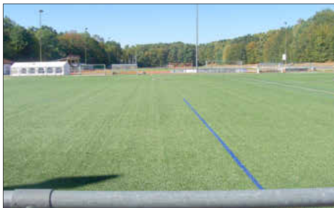
Corona: Der Ball, und somit auch der Spielbetrieb, müssen ruhen im Franz-Hagen-Stadion.

Liebe Freunde, Fans, Gönner und Spieler des FC Phönix Bellheim, erneut sind nun wieder erhebliche Einschränkungen durch COVID 19 und die damit verbundenen Restriktiven durch Bund, Länder und Gemeinden seit dem 2. November eingetreten und beschlossen worden.