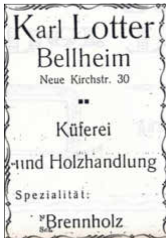
Die Prälat-Storck-Straße war damals die „Neue Kirchstraße“

Der Historische Arbeitskreis freut sich über jegliche Art von Informationsmaterial zur Erforschung der Bellheimer Geschichte. Ob Bildmaterial, Schriftstücke, Plakate, Audiodateien, Negative, Dias, 8 mm Film oder Videomaterial nehmen wir in unser Archiv auf, auch zur Digitalisierung überlassene Objekte sind immer willkommen. Kontakt unter: Kontakt@Kulturverein-Bellheim.de