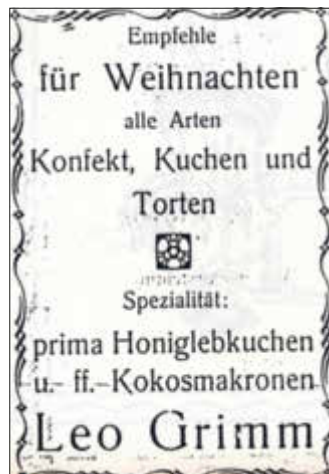
Vorgänger der kürzlich geschlossenen Bäckerei Kaiser

Dadurch bedingt, wurde auch von Seiten des Südwestdeutschen Fußballverbandes (SWFV) der komplette Spiel und Trainingsbetrieb bis auf weiteres eingestellt. Wie es mit dem regulären Spielbetrieb sowohl in der Aktivität als auch in der Jugend nun weitergeht, hierzu werden wir zeitnah berichten, sobald es etwas Neues dazu gibt. Bitte haben Sie Verständnis dafür, dass wir gerade deswegen, da der Spielbetrieb bis auf weiteres eingestellt ist, Sie nicht mehr wöchentlich wie gewohnt, hier in unserer Amtsblattausgabe mit Berichten aus unserem Verein informieren können. In dem Sinne, bleiben Sie gesund, und bis in Kürze.