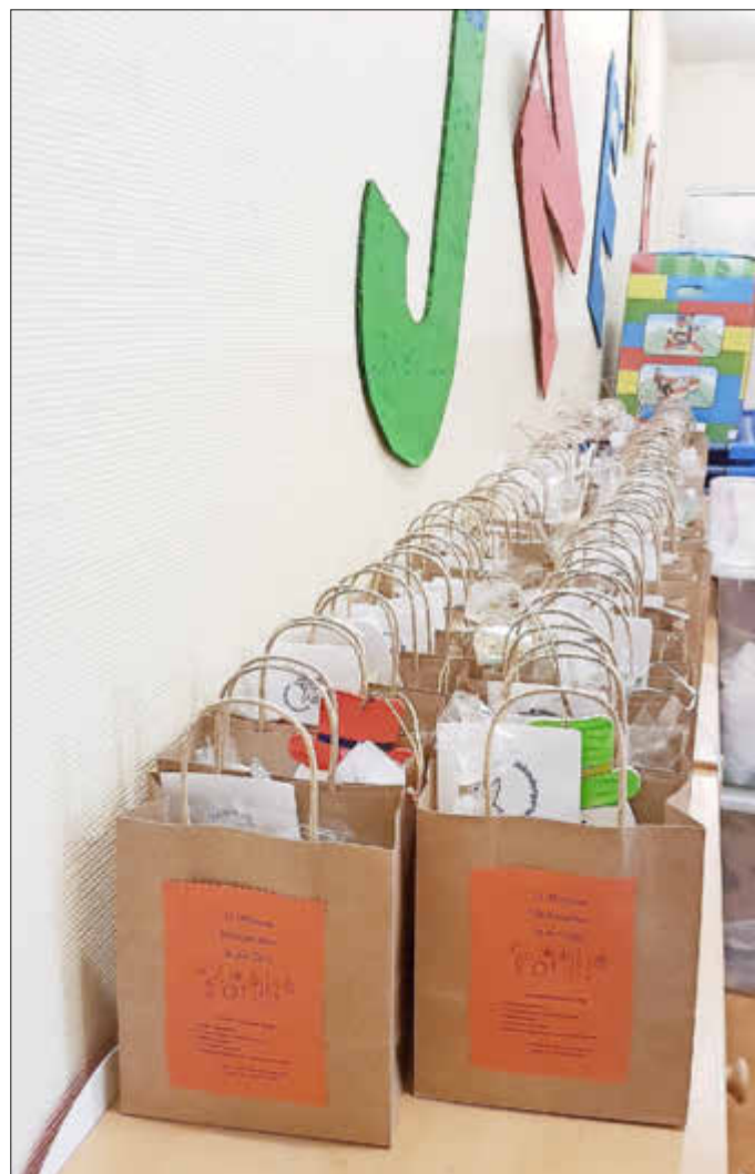
Gepackte Weihnachtstüten zur Abgabe bereit

An alle Helferinnen und Helfer möchten wir auf diesem Weg von Herzen „Danke“ sagen!