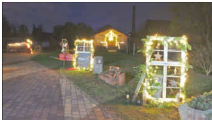
Auch in den Abendstunden ist die Aktion ein schöner Anblick

Die weihnachtliche Aktion am „Alten Sägewerk Mittelmühle“ kann bis zum 10. Januar 2021 besichtigt werden.