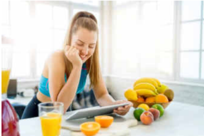
Vorsätze erfolgreich umsetzen mit den Online-Seminaren der AOK Rheinland-Pfalz-Saarland

Neu: Vertiefungsseminare für Ausdauersportler