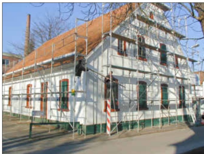
Im Januar 2001 begannen die Renovierungsarbeiten am Dach. Die Aufnahme der Aufstellung des Gerüsts stammt vom 16. Januar 2001. Eine Woche später erfolgten die Arbeiten am Dach.

Mit einem Tag der offenen Tür im Januar 2001 wurde der ehemalige Kindergarten in der Karl-Silbernagel-Straße der Öffentlichkeit zugänglich gemacht. Viele der 500 Besucher dieses Aktionstages betreten Räumlichkeiten die viele Erinnerungen weckten. Über 30 Jahre lag 2001 bereits die Nutzung als Kindergarten zurück. Natürlich hatte der Zahn der Zeit kräftig am Bauwerk und der Infrastruktur genagt. Trotzdem hatten zahlreiche Personen, die als Kinder hier waren, das eine oder andere wiedererkannt. Mit den Erinnerungen unserer Gäste und die damals zahlreich geschilderten Erlebnisse konnte man zahlreiche Buchseiten füllen.