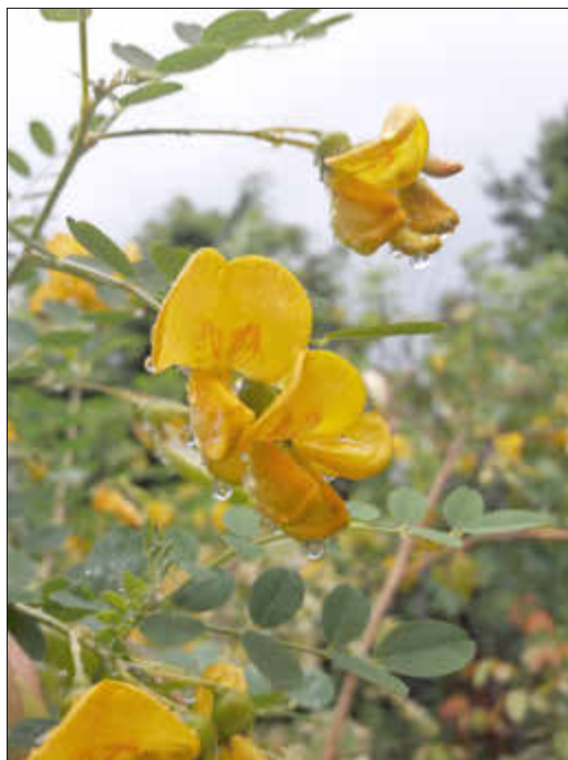
Der Blasenstrauch ist eine bei Wildbienen beliebte Pflanze.

Wer gerne Vögel in seinem Garten beobachtet, kann mehr tun, als im Winter ein Futterhäuschen aufzustellen und Meisenknödel aufzuhängen. Denn Vögel lieben Gärten, in denen sie im Winter viele Versteckmöglichkeiten haben – und die ihnen das ganze Jahr über ausreichend zu naschen bieten. Also Spinnen, Insekten, deren Raupen und Larven – und Beeren.