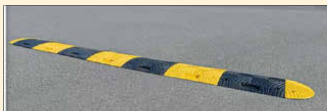
Das Bild zeigt die Optik einer geplanten Schwelle.

Liebe Autofahrer, achten Sie auf die Bodenschwellen und fahren Sie langsam - für unsere Kinder im Ort!