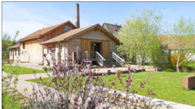
Das Alte Sägewerk hofft auf zahlreiche Besucher

Aufgrund der aktuellen Situation erfolgt am Eingang des Geländes die Kontaktdatenerfassung. Erfassung ist auch über die Luca-App möglich. Zutritt kann nur mit einem gültigen Impfnachweis oder einem gültigen Corona-Schnelltest erfolgen. Der Eintritt ist frei.