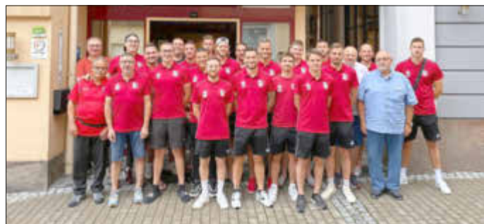
Das Trainingslager-Team zum Abschiedsfoto vor dem Hoteleingang mit dem Gastgeber.

Bellheim, Donnerstagmorgen kurz nach 9 Uhr: Abfahrt ins rund 190 Kilometer entfernte Ehingen an der Donau. Es ging in den Endspurt der Vorbereitung, das Trainingslager.